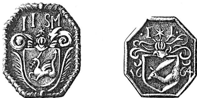
Fig. 1 et 2. Joseph Jacot Guillarmod, 1662, 1664.

Joseph Jacot Guillarmod, né en 1603 à Clermont près de La Chaux-de-Fonds, d'une famille originaire de La Sagne, fit une belle carrière militaire au service étranger. Nous le trouvons en 1645 capitaine au Régiment de la Roque-Bouillac au service de France puis, quelques années plus tard, capitaine des troupes de la République Sérénissime de Venise. Entré en 1657 au service du Roi de Danemark, il a la charge de capitaine de cavalerie au régiment de dragons de Gyl-denøve. En récompense de sa conduite glorieuse lors du siège de Copenhague par les Suédois en 1658-1659, ce régiment fut promu Régiment des gardes de la Reine. Joseph Jacot Guillarmod, dénommé habituellement Joseph Jacob Schwitzer, en raison de son origine, nommé major en 1661, commande dès 1662 la forteresse de Nyborg en Fionie où il paraît être resté jusqu'en