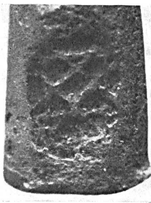
Fig. 1. Marteau aux armes de Joux, XV e siècle.