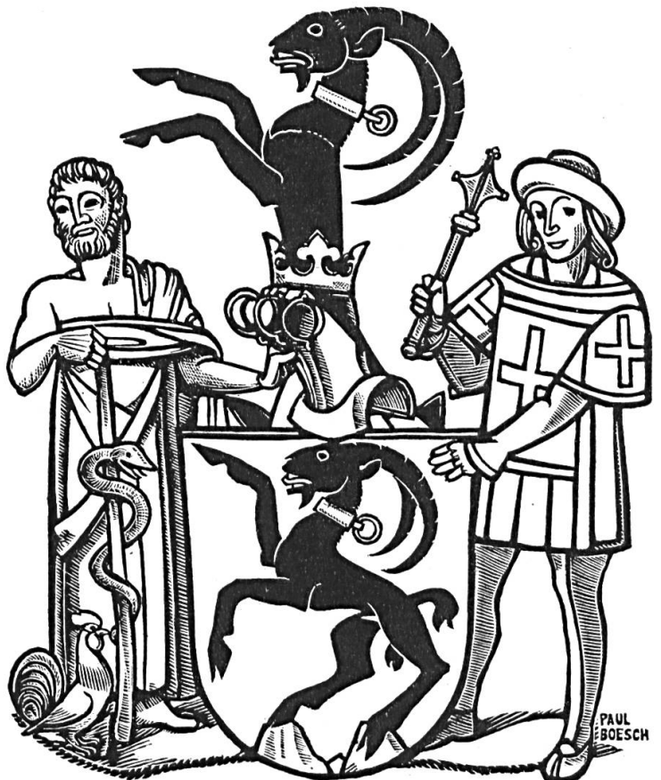
Fig. 1. Bois gravé héraldique de Paul Boesch.

Paul Boesch a replacé le blason au premier rang des réalisations artistiques de son pays, la Suisse. S'inspirant de l'art dépouillé et réaliste de l'héraldique médiévale, extrêmement cultivé, doué d'un talent et d'une intelligence magnifiques, il a donné à ses