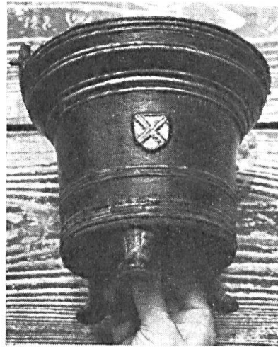
Fig. 1. Bénitier aux armes de Leugney.

L'église de Leugney (hameau de la commune de Bremondans, département du Doubs), si riche en souvenirs archéologiques, possède un bénitier en bronze sur lequel