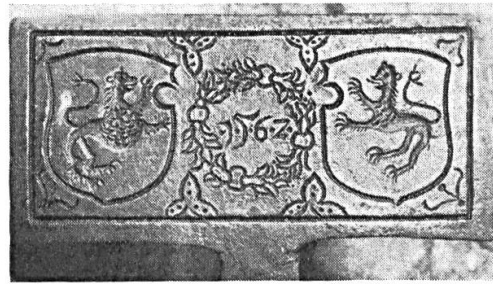
Fig. 10. Indéterminé, 1562.

Cette plaque provient de la ferme «du Bas des Vaux», commune de Filain.