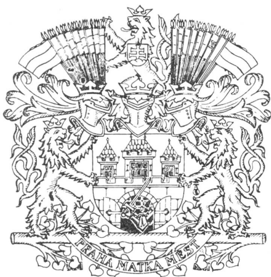
Abb. 1. Wappen der Hauptstadt Prag, 1927.