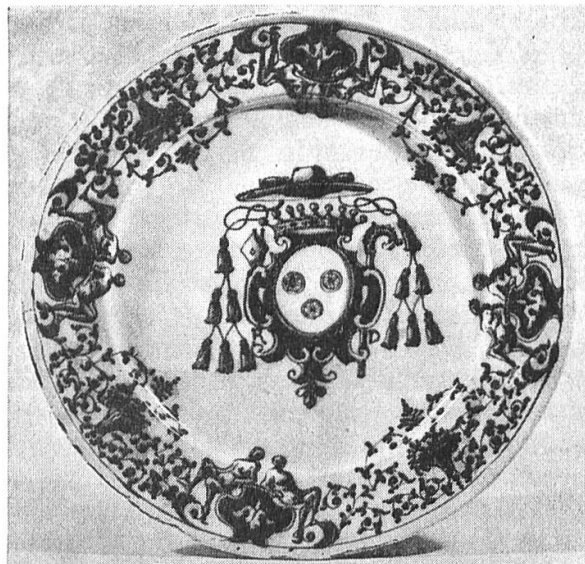
Fig. 1. Plat aux armes Rovero, d'Asti

Joseph Rovero, évêque d'Alba, 1697-1727, et plus tard, Jean-Baptiste Rovero, évêque d'Acqui, 1727-1744, avant d'être archevêque de Turin, 1744-1768, et cardinal, 1756; et