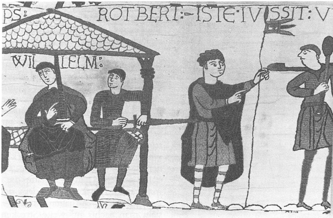
Abb. 3. Hier erscheint Rotbert zweimal: bei der Beratung im Hause und — mittels des gleichen Tricks wie in Nr. 1 durch das hinweisende Schwert bezeichnet — als Befehlshaber mit dem Wimpel Wilhelms, als Zeichen, dass er in seinem Namen handelt. Auch in der Begleitschrift erscheint eine Spitze, die unter «Rotbert» und «ISTE» ein und dieselbe Person deuten lässt.

Weise wiederholen: in einem quadratischen hellen (= weissen) Felde ein terrakotta-rotes Kreuz und ein blau-grünes Bord. Von den Ausnahmen wird der eine Wimpel von Wilhelm, dessen Name darüber steht, selbst gehalten, als ihm ein Kundschafter über Harolds Heer berichtet (Abb. 2). Den anderen Wimpel hält ein Edler, der in einer der vorausgehenden Szenen den Auftrag zur Erbauung des Lagers erteilt. Es handelt sich meines Erachtens um Rotbert, mit dem und mit Odo sich vorher Wilhelm im Hause beraten hat. Das von Rotbert dort waagrecht gehaltene Schwert zeigt bewusst aus dem Hause heraus und berührt den Edlen. «Iste» = jener da — so sagt die Beischrift — bestätigt die beiden Ritter als Rotbert. Zum Zeichen, dass er im Auftrage des Herzogs spricht, hält er dessen Lanzenflagge (Abb. 3).