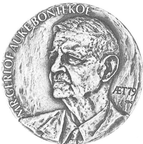
Abb. 1. Avers der Medaille für G. A. Bontekoe.