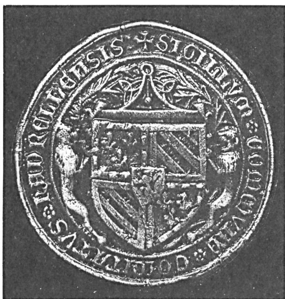
Fig. 1. Sceau de la cour du comté de Charolais

Un passage du chroniqueur Monstrelet est particulièrement explicite à l'égard d'un autre emblème — le niveau de maçon — distribué le premier de l'an 1409: Et lendemain qui fut le jour de ladicté Circuncision, du