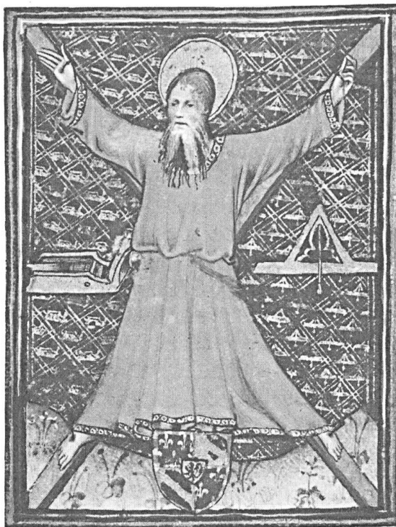
Fig. 2. Détail du folio 172 V o du Ms. N. acq. Lat. 3055 (cl. J.B.V.)

Les représentations du niveau de maçon sont beaucoup plus rares. Deux peuvent cependant être citées. Le livre d'heures de Jean Sans Peur conservé à la Bibliothèque Nationale de Paris 8 montre une miniature représentant Saint André (fig. 2): Sur un fond d'azur semé de rabots d'or et de niveaux de maçon également d'or, l'apôtre, vêtu d'une tunique vermillon est cloué à une croix en sautoir 9 . Il est accosté à dextre d'un rabot et à sénestre d'un niveau de maçon. Au bas un écu écartelé aux 1 et 4 semé de France à la bordure componée d'argent et de gueules, aux 2 et 3 bandé d'or et d'azur à la bordure de gueule, sur le tout d'or au lion de sable armé et lampassé de gueules.