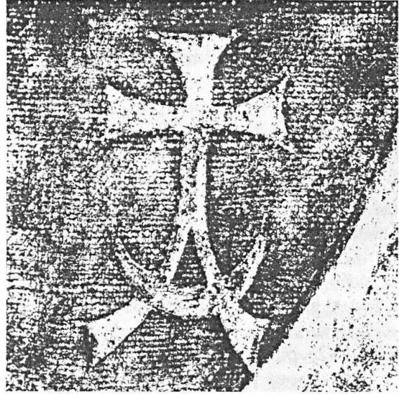
Abb. 2. Zeichen auf Medaillon der Verkündigung.

Innerschweizer Familie handelt. Aber auch alle Nachforschungen in den Wappenbüchern und Archiven von Basel, Strassburg, München, Augsburg und Zürich blieben erfolglos. Es muss sich aber um ein wohl weltliches Stifterwappen handeln und ist bestimmt keine Phantasieschöpfung. In der zweiten Hälfte des 15. Jahrhunderts haben zahlreiche Geschlechter ihre Wappen gewechselt, und Mitglieder derselben Familie führen verschiedene Embleme. Nachdem der Maler nicht bekannt ist, erschwert dies eine Identifikation zusätzlich. Vielleicht ist es kein Zufall, wenn sich das unbekannte Wappen unter dem Messdiener befindet, nachdem es auch anderswo hätte plaziert werden können. Sind Stifter und kniender Ministrant identisch? Das Wappen scheint eher zum Messdiener als zum Priester am Altar zu gehören. Ähnliche Beispiele auf Glasscheiben und Holzreliefs sind bekannt, wie der Stifter kniet und sein Wappen vor oder hinter sich hat. Dass das schwarze Schildhaupt aus dem Wappen der Ehefrau des Stifters übernommen worden sein könnte, ist unwahrscheinlich, da für einen zweiten Schild an der Fußstufe des Altars genügend Platz vorhanden gewesen wäre.