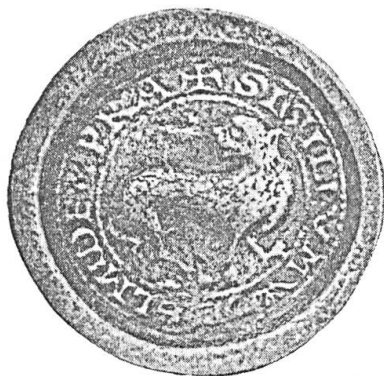
Fig. 1. Contre-sceau de Guillaume d'Ypres (1158) ø 38 mm env. AGR Bruxelles, moulage 21709 (Photo AGR Bruxelles).

jours est-il que, à partir du moment où, un siècle plus tard (vers 1266-1275), des descriptions ou des représentations en couleurs du lion de Flandre existent, celui-ci est de sable sur or.