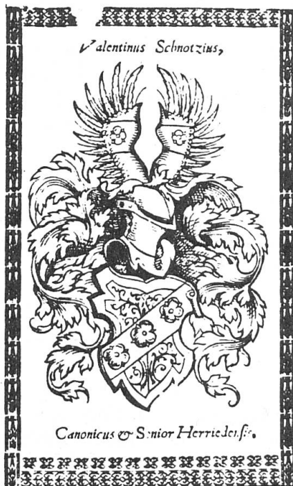
Ex-libris de Valentin Schnotzius

Boochs versuchte in der von Professor Philippe Derchain betreuten Dissertation, die Bedeutung des Siegels als Rechtsmittel in Ägypten aufzuzeigen und den Gehalt solcher Siegel zu definieren und zu werten: In den Abschnitten Siegel als Kennzeichen des Eigentümers , als Identitätszeichen , als Symbol der Macht und im Kapitel Siegeldelikte werden dem Leser anschaulich die Sphragistik und deren all-