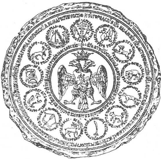
Fig. 4. Sceau d'Ivan IV le Terrible (1533-1584).