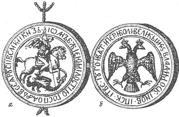
Fig. 3. Sceau d'Ivan III (1462-1505).