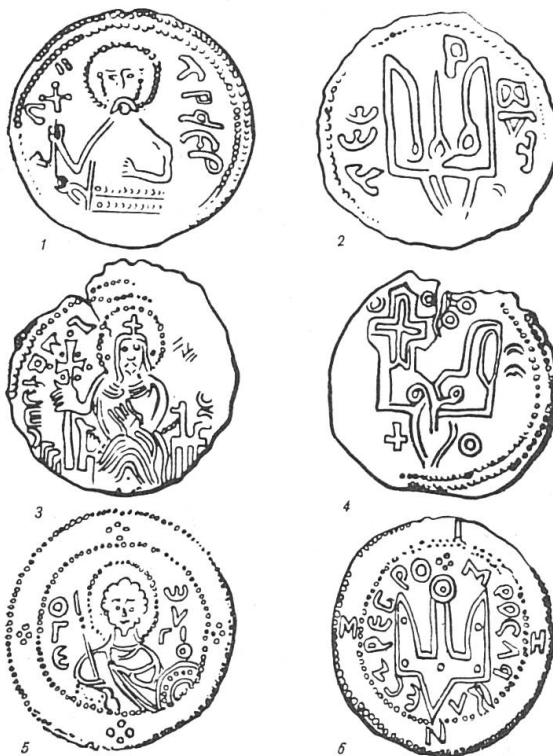
Fig. 2. Monnaies princières armoriées: 1-2: Vladimir Sviatoslav (c. 970), 3-4: Sviatopolk (c. 1000), 5-6: Iaroslav le Sage (c. 1030).

Il est prouvé que ces «armoiries» sont personnelles et qu'en passant du père au fils elles sont brisées soit par addition soit par simplification. La notion d'armes pleines est inconnue: la brisure demeure après la mort du père, la confusion entre deux générations ne doit pas être possible.