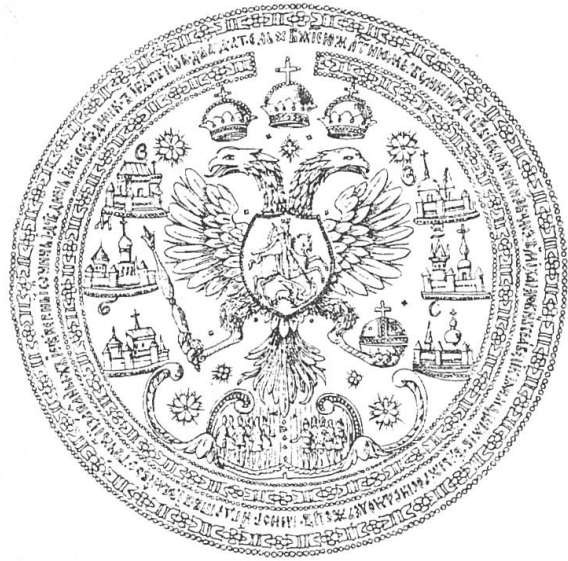
Fig. 5. Sceau d'Alexis Mikhaïlovitch (c. 1620).