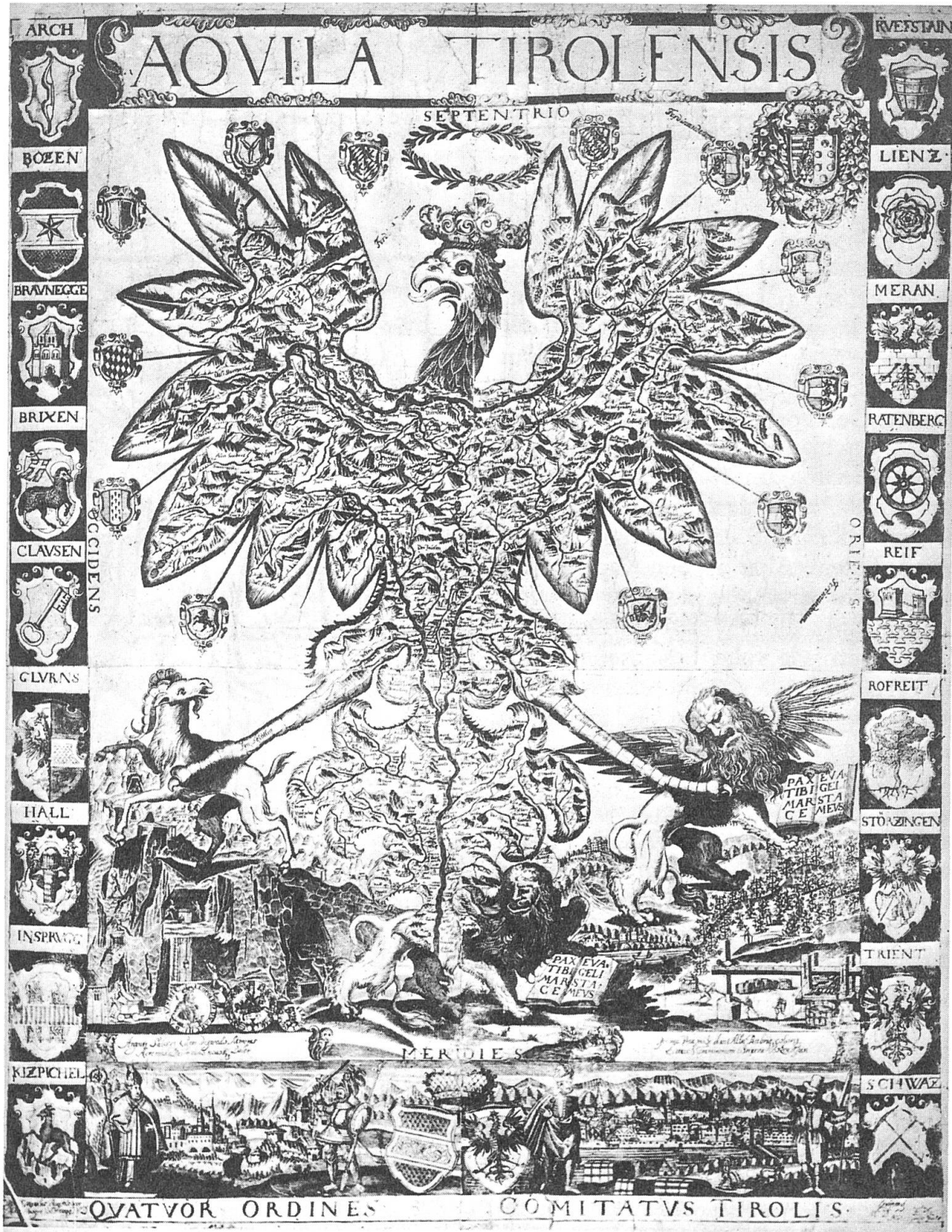
Fig. 2. Kupferstich von M. Burgklehner 1609/20.