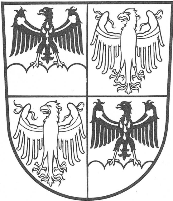
Fig. 4. Wappen der Region Trentino-Südtirol vorbehaltlich der Genehmigung.

(Abb. 4). Die Viertelung wird damit begründet, dass in der linken Hälfte des neugeschaffenen Wappen der Trienter Adler über dem Südtiroler und im rechten Teil des Schildes der Tiroler über dem Trienter 12 Adler steht 13 . So heikel kann die Wappenfindung sein!