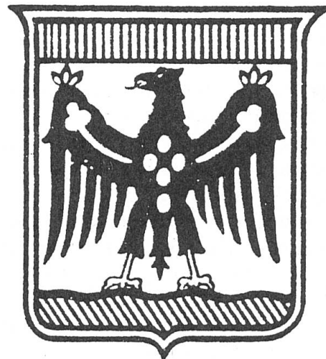
Fig. 3. Wappen der Provinz Trient 1927.

Ein entsprechender Vorschlag wurde im Juli 1982 auf Anregung des Präsidenten Pancheri vom Regionalausschuss gutgeheissen. Das neue Wappen ist geviertet: 1 + 4: In Silber über grünem Vierberg ein schwarzer goldenbewehrter Adler, mit roten Flammen auf seiner Brust und mit goldenen Flügelspangen (Trient), 2 + 3: in Silber ein roter, goldenbewehrter Adler mit goldenen Flügelspangen (Tirol)