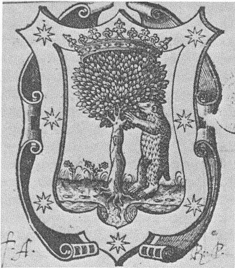
Fig. 1. Armoiries de Madrid, XVI e siècle.

De 1842 à 1967, les armoiries de la ville sont tripartites: au 1, d'azur au dragon d'or (Puerta Cerrada); au 2, à la composition traditionnelle, ours, arbousier, bordure étoilée ; au 3, d'or à la couronne civique de feuillage . Il avait été décrété en 1822 d'introduire la couronne civique dans le blason de la cité en récompense de la défense de la liberté espagnole; cette décision ne se réalisa toutefois qu'en 1842. Dragon et couronne civique sont supprimés en 1967 et l'écu retrouve son aspect d'avant la partition.