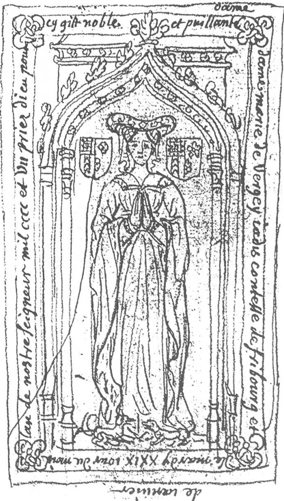
Fig. 1. Tombe de Marie de Vergy, comtesse de Fribourg et de Neuchâtel † 1407 à l'abbaye de Theuley.

M. de Vaivre examine attentivement les croquis exécutés par Boudan des dessins de Palliot et, les comparant aux photographies des pierres tombales encore existantes, il conclut à la parfaite exactitude et fiabilité des relevés. Il prépare la prochaine publication d'un livre, L'épitaphier de Pierre Palliot , basé sur les calques du président Bouhier. Le travail dont nous rendons compte ici et dont nous avons résumé l'utile introduction, commente aussi les caractéristiques de la tombe bourguignonne puis donne la reproduction de 248 d'entre elles, datant de 1238 à 1505. Les sources des dessins, un index héraldique et une table onomastique terminent cette remarquable étude dont les illustrations proviennent en majorité de photographies de l'auteur. Olivier Clottu.