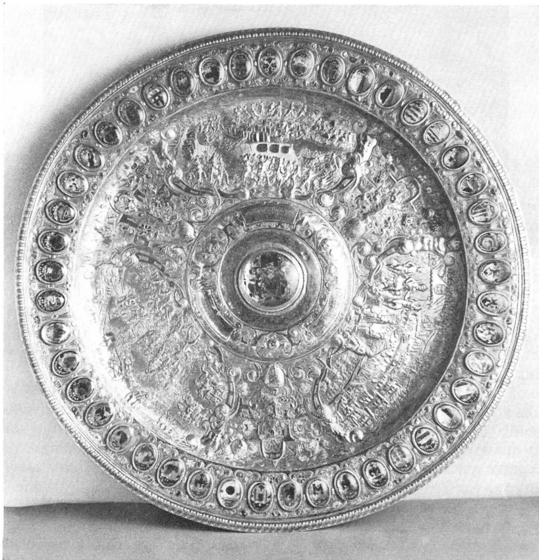
Fig. 3. Plat de vermeil aux armes des baillages de la République de Berne, 1583. (Les armoiries d'Yverdon se trouvent à 2 heures.)

vons au-dessous de la vue de Berne vers 1660 reproduite dans le DHBS . Il figure aussi mais sans l'Y au fronton de l'Hôtel-de-Ville d'Yverdon, construit en 1767.