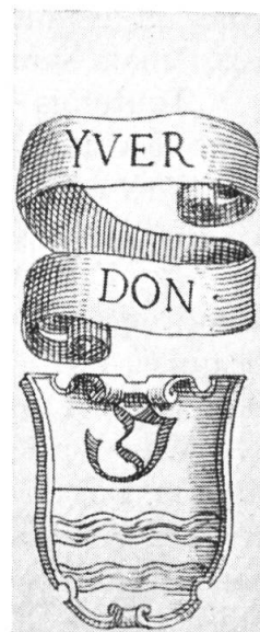
Fig. 2. Armes d'Yverdon 1578. (Carte de Schepf).

Ces quatre armoiries exécutées à Berne ont inversé les couleurs existant auparavant; est-ce simplement par erreur? Ce qui est certain c'est que ce nouveau type a fait école; nous le retrou-