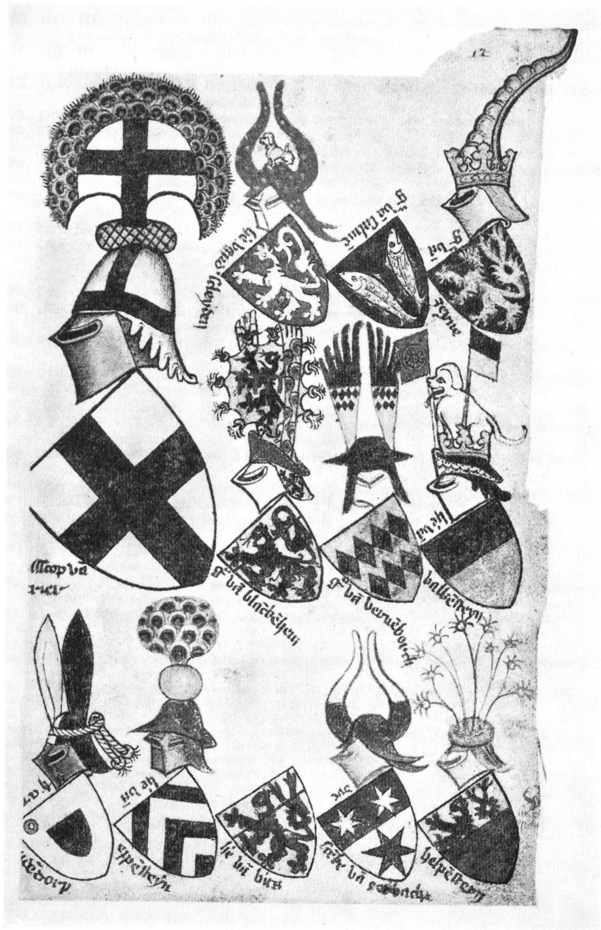
Planche IX. L'évêque de Trèves.