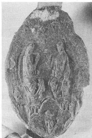
Fig. 3. Sceau de Barthélemy, ministre de la province de Bourgogne (1342).

Dans les notes de Théophile Dufour, ancien directeur des archives de Genève, se trouve la description suivante: «Sceau du Couvent de Rive. Le D r Gosse a trouvé à Genève et acheté pour 5 fr. en 1888 (avril ou mai) un sceau en bronze de ce couvent. J'y lis: S. FRRM STI FRI COIS D. GEBENIS (en car. goth.). Armes: une croix de sable cantonnée de quatre têtes d'aigles. Ce sceau est d'une si bonne exécution qu'on peut l'attribuer au