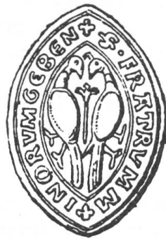
Fig. 1. Sceau du Couvent de Rive.

Utilisé de 1304 à 1525. Sceau en navette, env. 35 mm×25 mm. Deux oiseaux adossés, les têtes contournées, picorant une fleur qui les sépare. Légende en exergue, entre deux traits: ·S· FRATRVM M+INORVM GEBEN+ ( Sigillum fratrum minorum gebennensium. ) AEG, PH 147, 12 décembre 1304. Cire brune. AEG, PH 231, 11 avril 1342, cire verte foncée. AEG, Rive, grosse 16, f. 93, 3 juillet 1525. Plaqué, cire sous papier. Voir figure 1. (Dessin illustrant l'article de Choisy.)