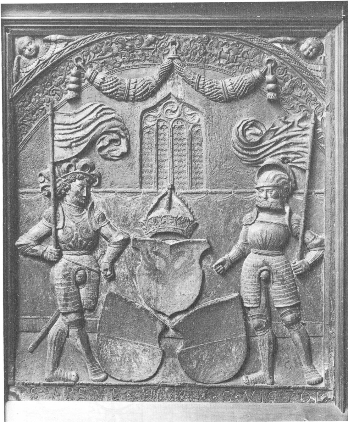
Abb. 2. Original der Holztafel von 1541 mit der ausführlichen Darstellung des Standeswappens von Solothurn, im Historischen Museum Basel. Lindenholz, bemalt. Höhe 108 cm, Breite 95 cm.