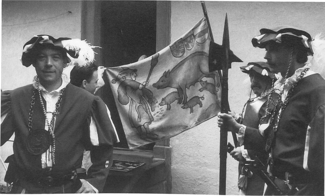
Fig. 2. Saubanner