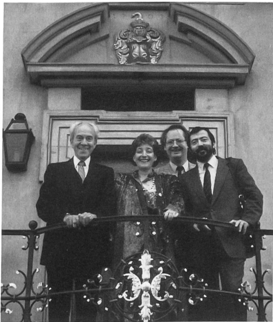
Fig. 3. Gasthof Wart, Hünenberg