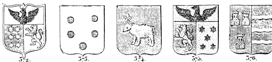
Fig. 2 Quelques écus du Nouveau Manuel complet du blason , 1843; Bonapart, Fortuny, Cos, Bonapart, Gari.

Adresse des auteurs: Léon et Michel Jéquier La Gracieuse CH-1027 Lonay