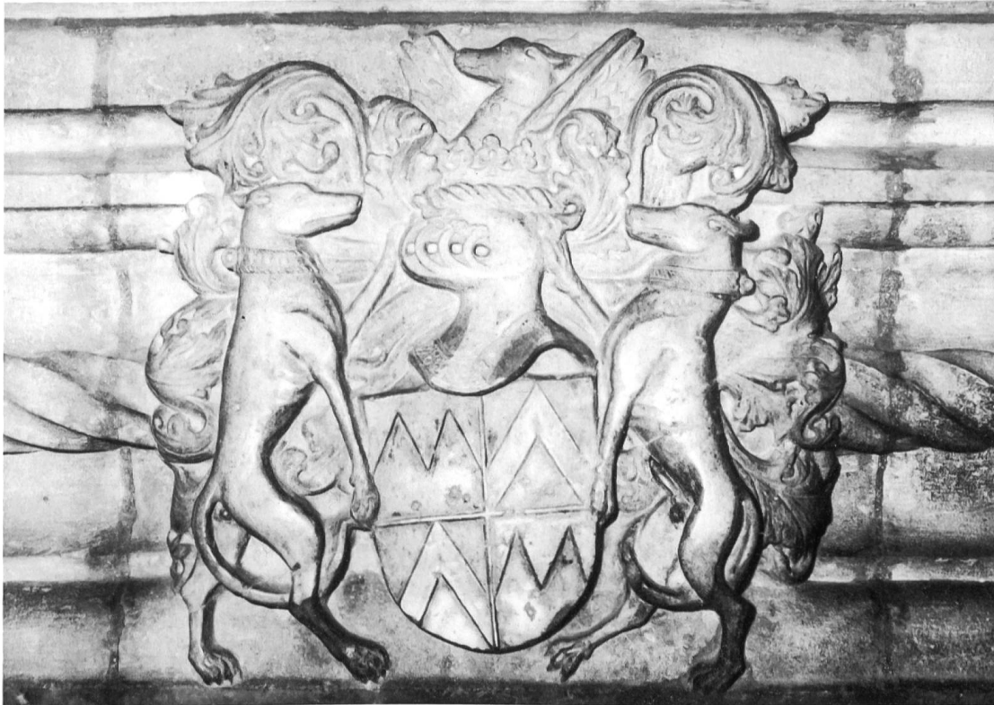
Armoiries Vaudrey de Montrost, cheminée provenant du château de Valleriois-le-Bois (Hte-Saône), actuellement à l'hôpital de Vesoul.