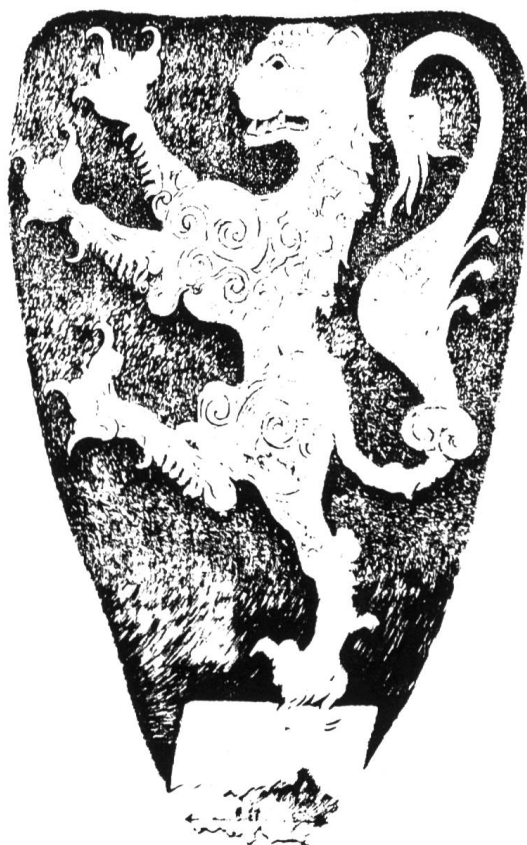
Abb. 4 Schild der Herren von Brienz (Arnold von Brienz). Frühes 13. Jahrhundert. Original im Schweizerischen Landesmuseum. Aus Seyler: G.A.: Geschichte der Heraldik, Nürnberg, 1890.

Frage lösen: Urner Studenten hätten das Wappen von der von ihnen besuchten Universität Altdorf-Nürnberg zurückgebracht. Im Dorfbüchlein von 1684 ist das Altdorf-(Uri) – Altdorf-(Nürnberg)-Wappen aufgezeichnet. Eine wunderliche Sache, wunderlicher und interessanter als das Thema der «sprechenden Wappen». Herr Büchi berichtet uns über die Geschichte von Altdorf, dessen erste Siedlungsspuren aus der Alemannenzeit stammen. Ein Streifzug durch die Urnergeschichte endet mit dem nachdenklich stimmenden Schluss-Satz: «Alles, was die Zukunft uns noch bringt, ist unklar.» Damit meint der Vizepräsident der Gemeinde wohl die unselige Entwicklung von Verkehr und Industrie.