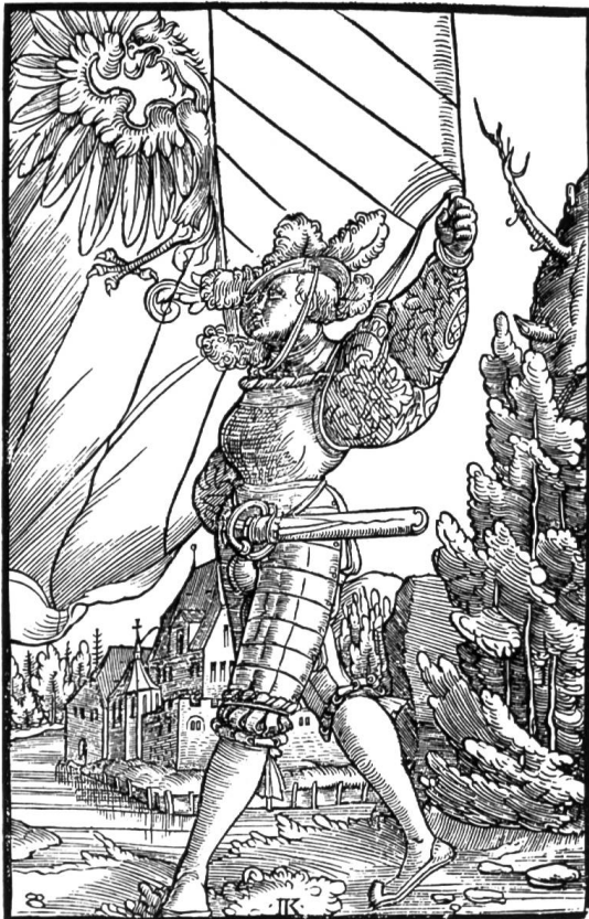
Abb.2 Bannerträger Nürnberg. Aus dem erstmals von Cyriacus Jacob 1545 verlegten Werk: Wapen Des heyligen Römischen Reichs mit Holzschnitten des Meisters I.K. Reprint Walther Uhl, Unterschneidheim, 1969.