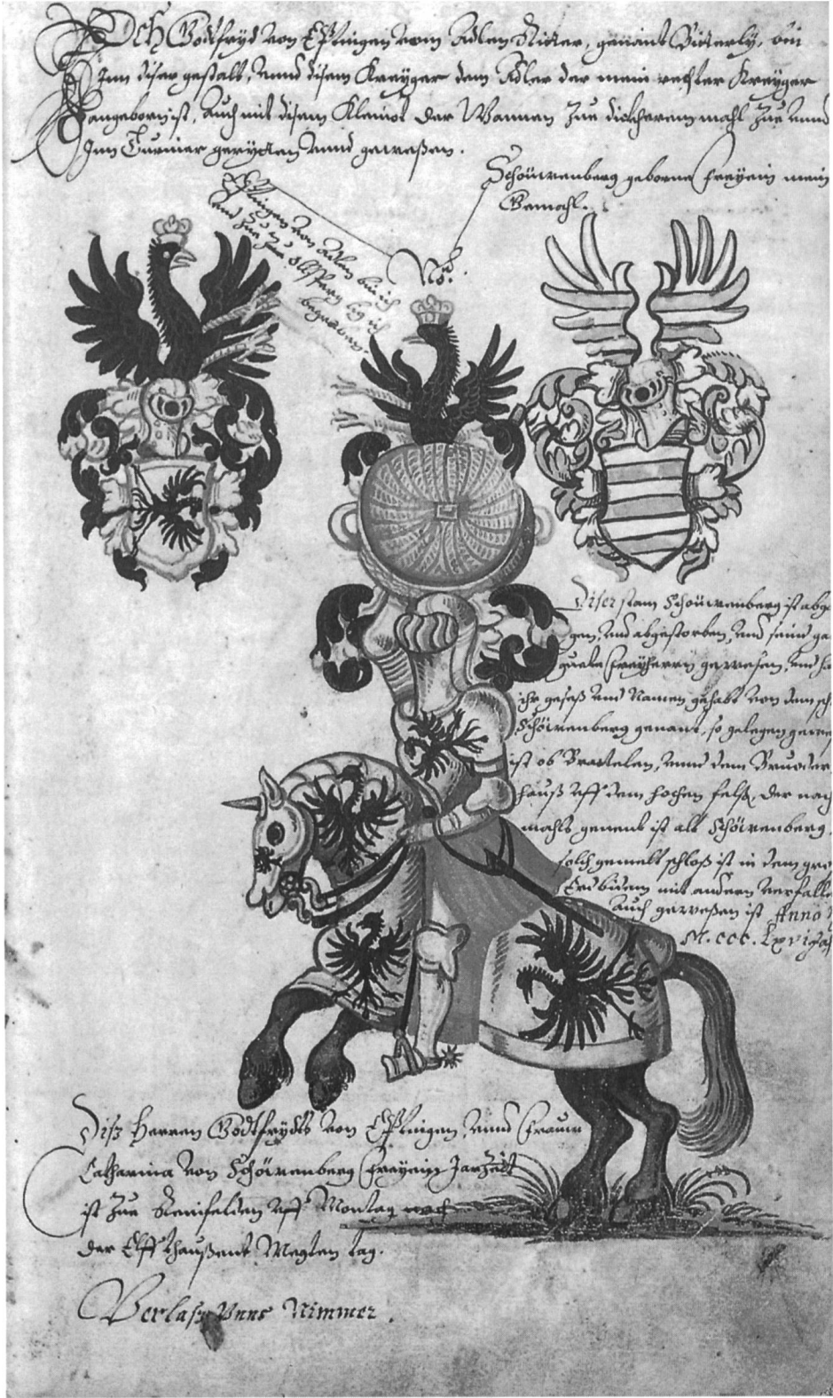
Abb. 4 Wie bei Rudolf werden mit Gottfried von Eptingen Turnierfähigkeit und Familientradition dargestellt. Zusätzliche Nachrichten über die Herren von Schauenburg sind eingefügt (Fol. 51 r).