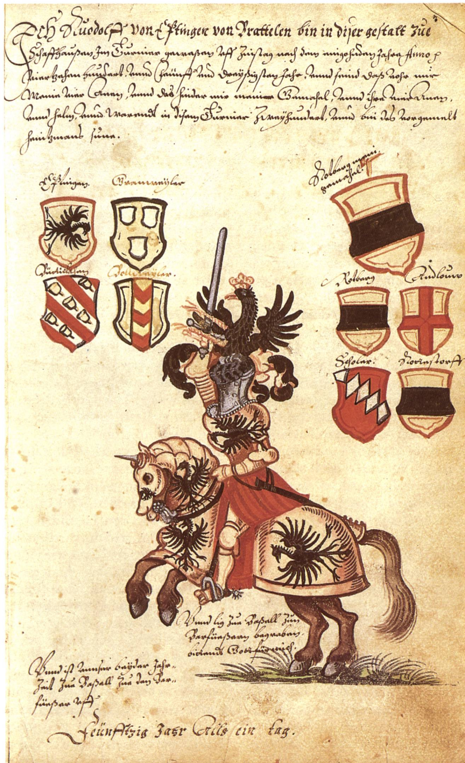
Abb. 5 Rudolf von Eptingen von Pratteln in voller Turnierrüstung. Die Kombination von Text, Ausrüstung und Wappen der Vorfahren unterstreicht Rudolfs Turnierfähigkeit. Die Mitteilung von Grablege und Jahrzeit betont die standesgemässe Religiosität der Familientradition (Fol. 50r).