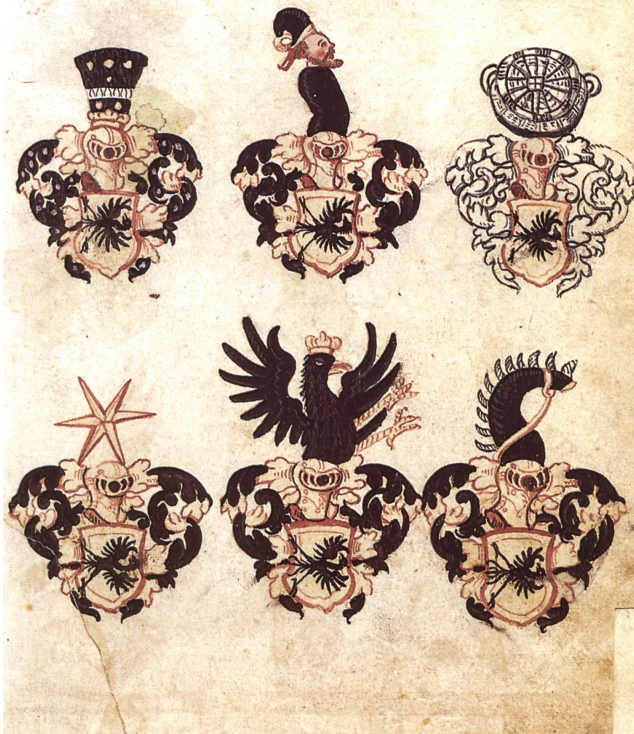
Abb. 3a/b Eptinger Wappen (Fol. 37r/37v).

Die zu Kreigere Von Eplingen hat der Stam Von Eplingen all getson fuesren. Vero sie noch außt Heüts disen tag. Vund datum Anno 7. zum dem Namen Gottes, elliche fuesren tsüent. außs so lang Gott der Allmechtig will der den abgangnen barmherzig sein wölle, vund disen außs damit Amer. so noch leben.