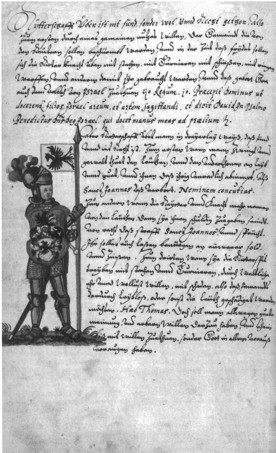
Abb. 7 Zum einzigen Text im Familienbuch, der das Ritters tum der Eptinger theologisch abzustützen versucht, wird ein vollgerüsteter Ritter dargestellt. Er trägt einen Visierhelm und hält einen Speer mit Speerfahne. Die Pratteler Helmzier erscheint nur noch als Schildbild. Heraldisch gesehen ist dies eine frühneuzeitliche Darstellung, denn erst ab dem 16. Jahrhundert wurden Helmziere nicht mehr auf den Helmen getragen (Fol. 47 v).