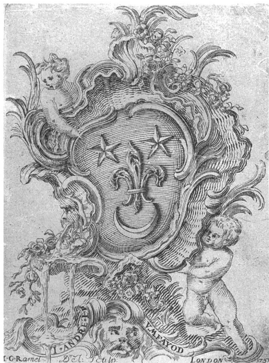
Ill. 1 Ex-libris Fayod gravure sur cuivre 95 x 71 mm; coll. privée