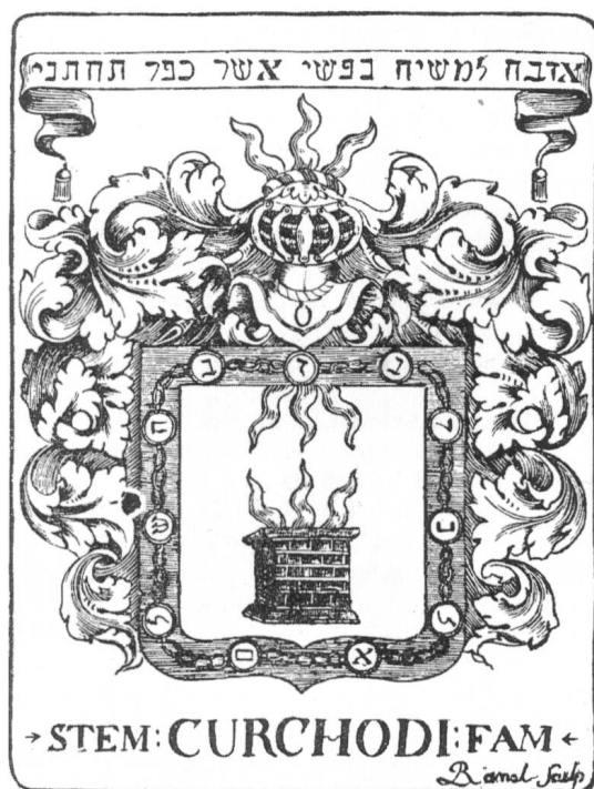
III. 3 Ex-libris Curchod gravure sur cuivre 85 x 63 mm coll. privée