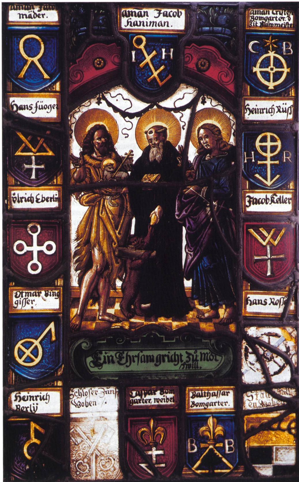
Les armes Bingisser figurent en bas à gauche du vitrail. La SSH remercie l'auteur d'avoir offert la planche en couleurs.