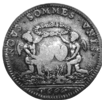
Ill. 8 et 9 Ill. 150%