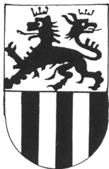
III. 5: DE STOPANIS de clavena

Le Musée des Arts Décoratifs de Lyon possède deux superbes plats de faïence ornés de ces armoiries. Celui que nous reproduisons ici