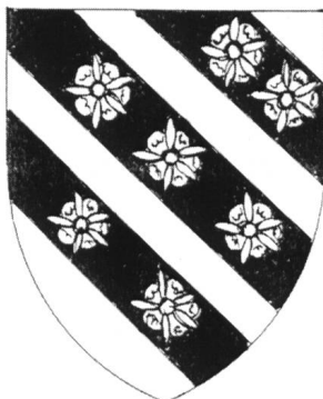
III. 1: BERNY