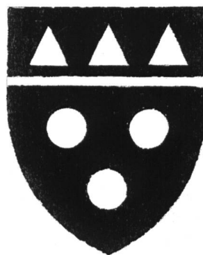
III. 2: MADIÈRES