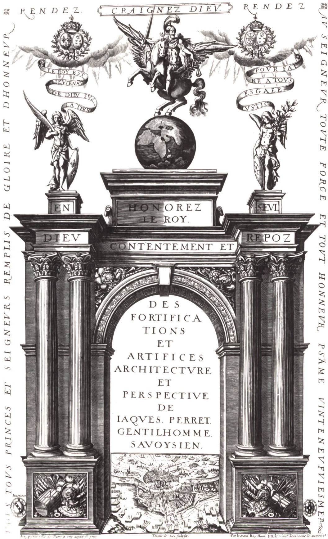
Ill. 1 Page de titre gravée du traité de fortification de Jaques Perret (1601).