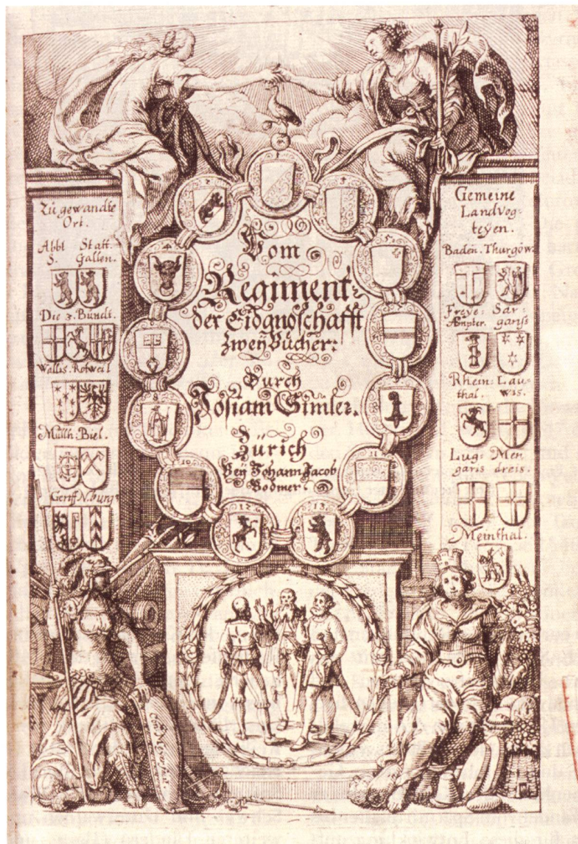
Fig. 4. Josias Simler «Regiment gemeiner loblicher Eydgnoschaft», 16. Jahrhundert

Bundesschwur, die Landespersonifikation Helvetia, Krieger, Alpenlandschaft. Zwei Putti halten einen Freiheitshut über den Wappenkranz, und unmittelbar darüber erkennt man das Zeichen der Trinität. Über der Eidgenossenschaft gibt es keine irdische Gewalt, sie ist unmittelbar zu Gott – also souverän. Und ihre Souveränität ist ewig, wie das Feuer, das in den Urnen flackert. Der Reichsadler als Universalzeichen hat ausgedient, ein Bild, das 1576 noch undenkbar war.