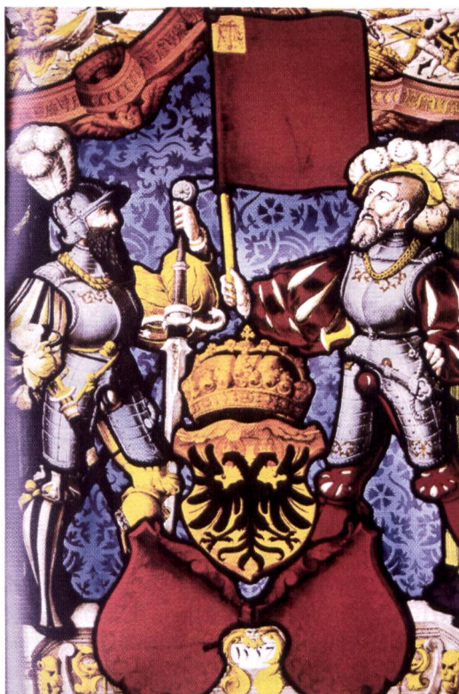
Fig. 1. Wappenscheibe des Standes Schwyz, 1557

legien von einem neuen Kaiser bestätigen liessen, so noch 1566 von Maximilian II. Die Rolle der freien Reichsstädte und Reichsländer in der Eidgenossenschaft gründete in den Rechten, die ihnen die Kaiser einst verliehen hatten. Eine zentrale Voraussetzung für jede Obrigkeit war der Blutbann, der ermächtigte, die Todesstrafe auszusprechen. Die einzige Instanz, die nach herkömmlichem Verständnis dieses und andere Privilegien gewähren und garantieren konnte, war der von Gott als oberste Ordnungsmacht eingesetzte Kaiser. Der gekrönte Reichsadler, wie er noch heute auf vielen Schweizer Stadttoren über dem Kantonswappen prangt, ist also kein Symbol der Unterwerfung, sondern ein Zeichen der Freiheit, die darin bestand, dass man unmittelbar zu Kaiser und Reich war.