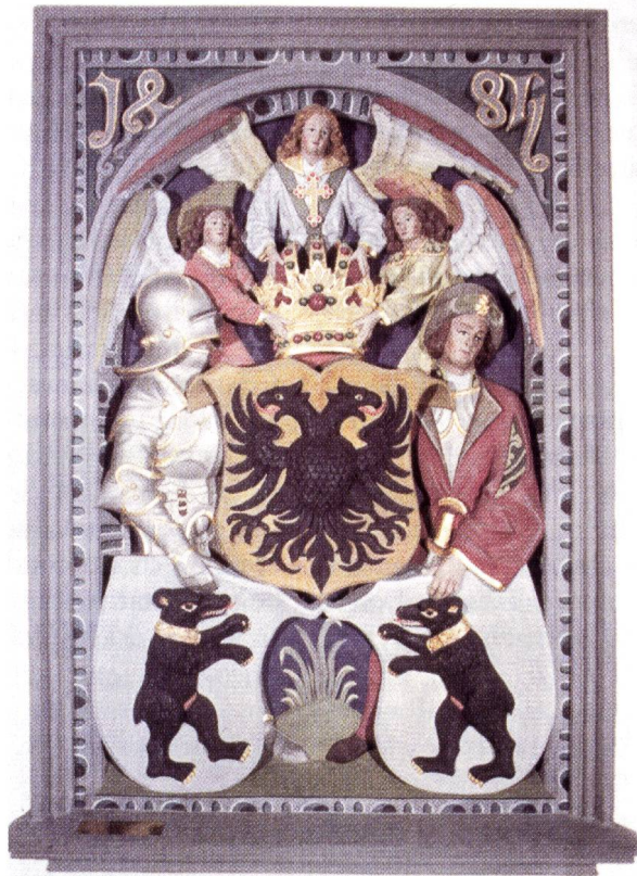
Fig. 2. Dreipass der Stadt St. Gallen

punkt wurde die Souveränitätslehre greifbar, doch überzeugte sie erst wenige: 1612 beschloss die Tagsatzung, die Privilegien bestätigen zu lassen. Dies unterblieb wegen der konfessionellen Spannungen im Reich, doch einzelne Orte und Zugewandte Orte, namentlich St. Gallen, liessen ihre Freiheiten vom Kaiser erneuern.