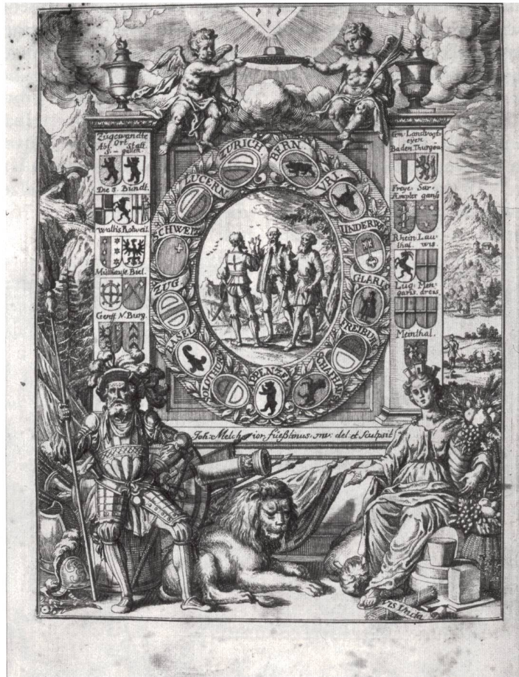
Fig. 5. Josias Simler «Regiment gemeiner loblicher Eydgnoschaft» von 1722

Die wenigen europäischen Republiken und protestantischen Staatswesen, die mit den mittelalterlichen Herrschaftssymbolen und heiligen Patronen ihre Schwierigkeiten hatten, leiteten den Übergang von den mittelalterlichen Zeichen zur modernen Staatssymbolik schon im 16. und 17. Jahrhundert ein. Gerade der Wappenkranz der Kantone scheint uns in ihrem Wandel vom Spätmittelalter bis zur Gegenwart für diese Entwicklung aufschlussreich zu sein.