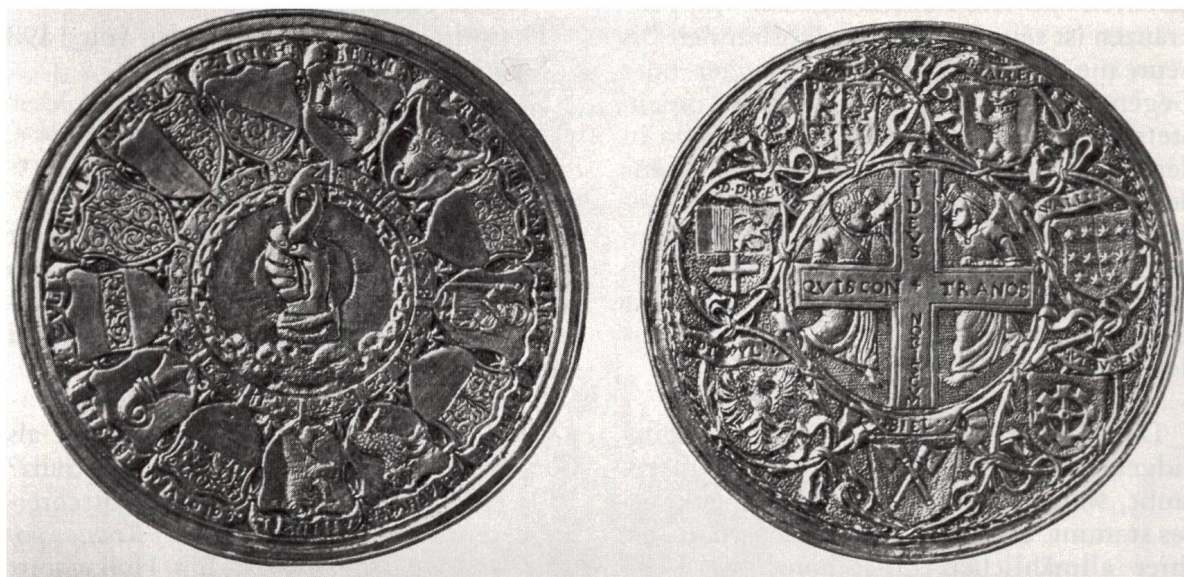
Fig. 6. Taufpfennig von 1548, geschaffen von Hans Jakob Stampfer

Die Ehrenmedaille für den Basler Bürgermeister Johann Rudolf Wettstein, der die staatsrechtliche Lösung vom Reiche 1648 erlangte, war auf der Vorderseite dem Taufpfennig sehr ähnlich, die Rückseite dagegen brachte zwar das Schweizerkreuz mit dem Spruch, aber es fehlt der umfassende Wappenkranz der Zugewandten Orte. An seiner Stelle steht die Umschrift « Concordia res parvae crescunt, discordia maximae dilabuntur ». Dieser Spruch dürfte mit grösster Wahrscheinlichkeit auf eine Anregung aus den Vereinigten Niederlanden zurückgehen. Den seit 1609 mehrfach geprägten Ambassadorspfennig schenken die Generalstaaten als Symbol ihrer Souveränität den Gesandten befreundeter Mächte. Seine Vorderseite zeigt den von zwei gekrönten Löwen gehaltenen Wappenschild der Niederlande mit dem Löwen, der ein Schwert und 7 Pfeile als Symbol der sieben Provinzen in seinen Pranken hält. Die Umschrift lautet « Concordia res parvae crescunt ». Auf der Rückseite finden sich die 7 Provinzwappen und als Umschrift der zweite Devise « Discordia maximae dilabuntur ».