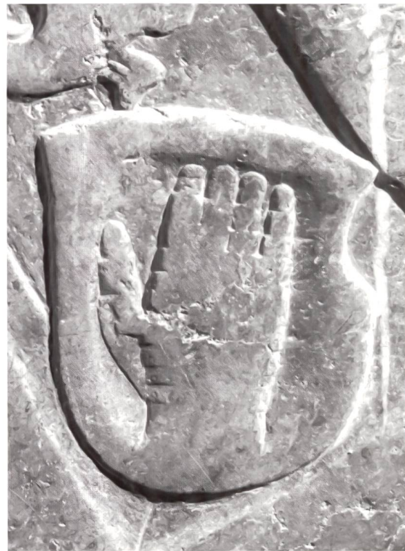
Abb. 4A–D: Vergrößerungen der unbekanntenen Wappen am Grabstein