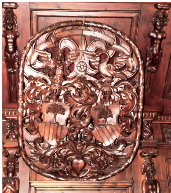
Bild 17: Allianzwappen Salis-Perari über der linken Seitentüre in der Stüa Salis.