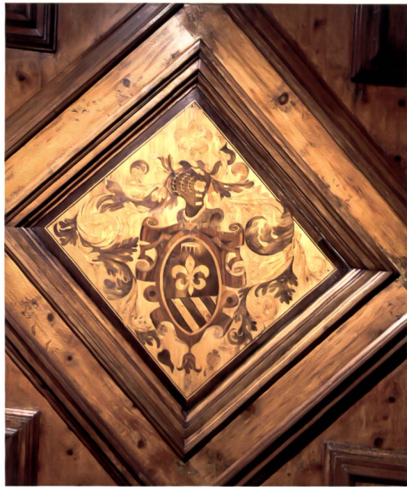
Bild 4: Unbekanntes Wappen an der Holzdecke der stüa Rigamonti. Die heraldischen Embleme weisen auf Veltliner Provenienz hin.

Wappen: «Geteilt, oben französische Lilie, überhöht von einer Krone, unten fünfmal schrägrechts gespalten. – Helmzier: Französische Lilie, überhöht von einer Krone.» Ähnliche Embleme zeigt das Wappen der Mingardini di Sondrio: «Scudo d'azzurro al giglio d'oro con una corona nel capo. – Cimiero: Il giglio d'oro.» Könnte es allenfalls eine Variante der Mingardini sein? Wir wissen es nicht. 29a