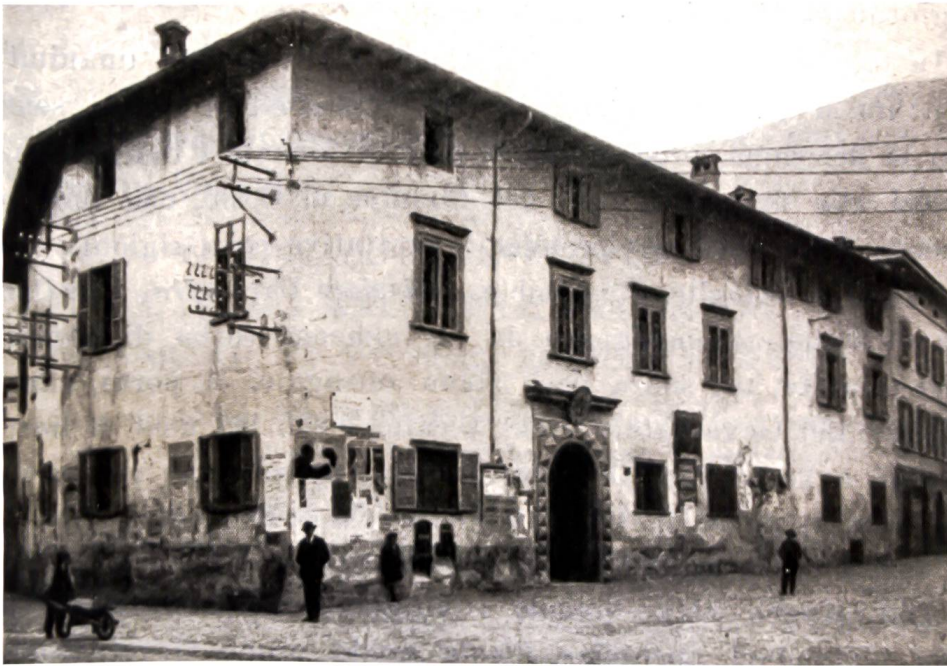
Bild 1: Aufnahme des Pretorios vor der Restauration von 1915/17. Es ist das älteste uns bekannte Bild und zeigt das Pretorio in einem desolaten Zustand. 23 Il Pretorio prima del restauro del 1915/17. La foto, la più antica a noi giunta, mostra il Pretorio in uno stato di decadenza e di degrado.

Truppen der Drei Bünde unter der Führung von Conradin Planta bekanntlich das Veltlin und die beiden Grafschaften Chiavenna und Bormio ein. Drei Jahre später nahm Rudolf v. Marmels, der als Erster vom Consiglio della Valle als Landeshauptmann anerkannt wurde, Sitz im Schloss Masegra oberhalb von Sondrio. Demnach könnte dies möglicherweise der erste offizielle Amtssitz des Landeshauptmanns gewesen sein, denn der Palazzo an der Piazza Campello stammt erst aus dem Jahre 1552. 22