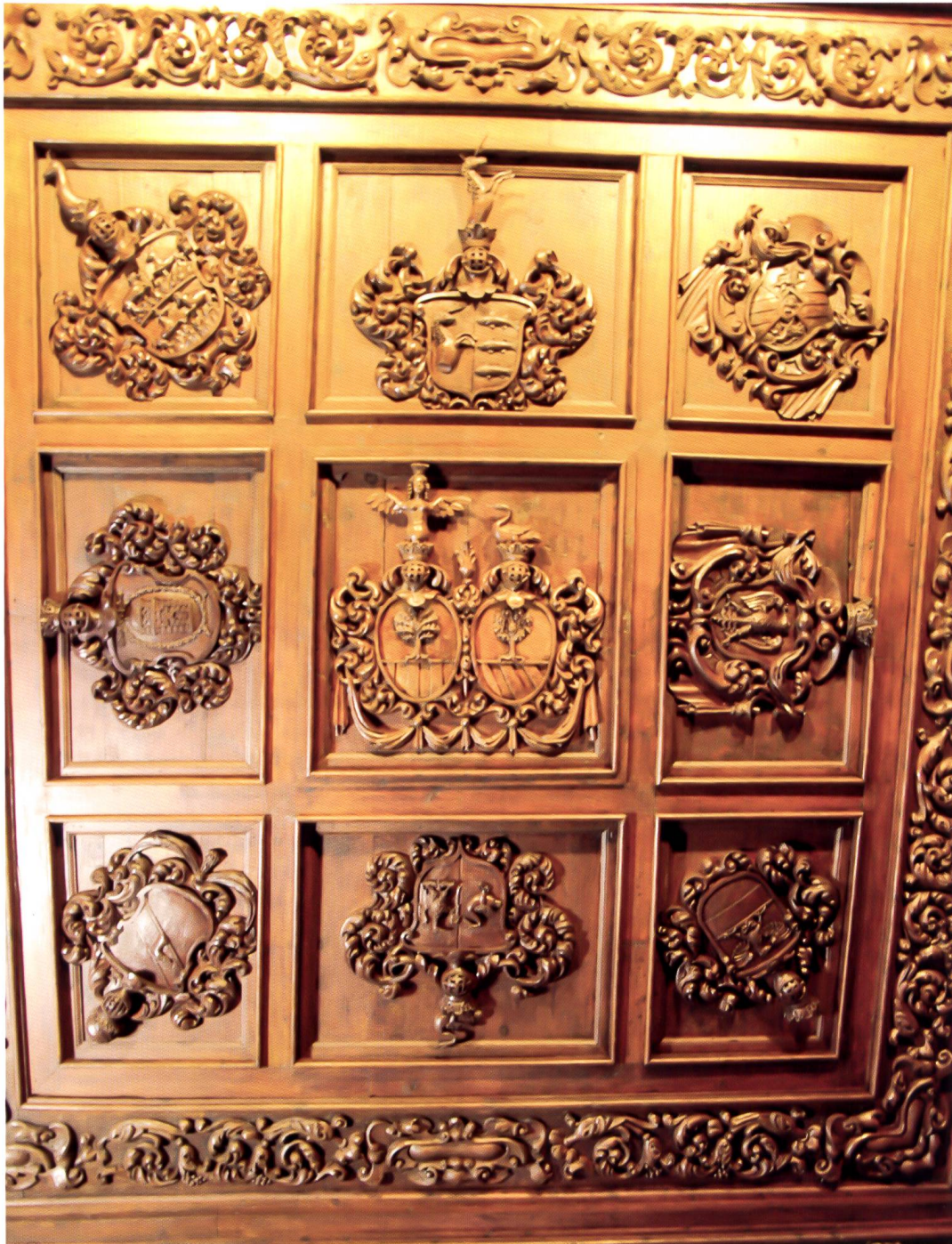
Bild 16: Kassettendecke in der Stüa Salis mit den Allianzwappen Salis-Perari im Zentrum und de Mont-von Schauenstein oben Mitte.

Soffitto a cassettoni nella Stüa Salis con al centro lo stemma d'alleanza Salis-Perari e nel mezzo in alto quello dei de Mont-von Schauenstein.