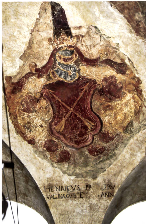
Bild 6: Wappen des Landeshauptmanns Heinrich Sprecher v. Bernegg. Stemma del governatore Heinrich Sprecher v. Bernegg.

Sprecher v. Bernegg stammte aus Luzein und war 1655/57 Landeshauptmann in Sondrio.