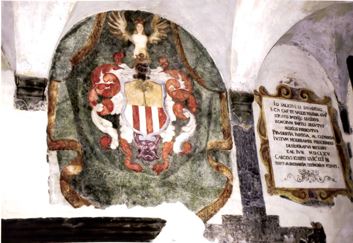
Bild 12: Wappen und lateinische Inschrift des Landeshauptmanns Johann v. Salis. Stemma con iscrizione latina del governatore Johann v. Salis.

Johann von Salis (1609–1680) stammte aus Samedan und war 1663/65 Landeshauptmann in Sondrio.