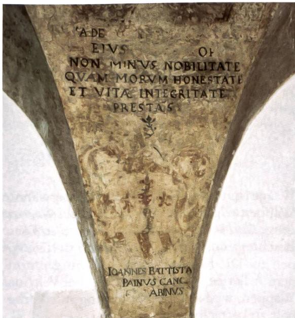
Bild 9: Wappen des Cancelliere Giovanni Battista Paini. Stemma del cancelliere Giovanni Battista Paini.