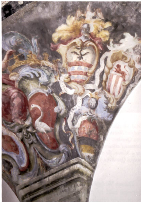
Bild 36: Wappen Lambertenghi, Chinali und Lazzaroni. Insegne dei Lambertenghi, dei Chinali e dei Lazzaroni.

Wappen Chinali: «Geteilt, oben in Silber schreitender roter Löwe, unten fünfmal von Silber und Rot gespalten. – Helmzier: Aus goldener Krone wachsend roter goldgekrönter Löwe.» Die Inschrift ist nicht mehr lesbar.