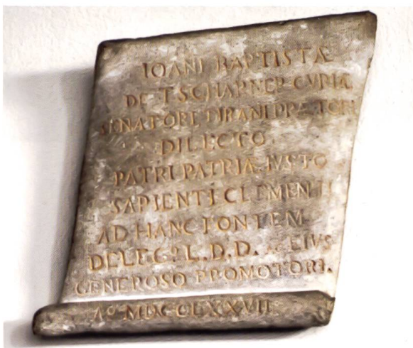
Bild 37a: Tafel aus weissem Marmor in Form einer Schriftrolle für Johann Baptista v. Tscharner. Tavoletta in marmo bianco a forma di cartiglio dedicata a Johann Baptista v. Tscharner.

Im Municipio von Tirano, dem ehemaligen Palazzo Marinoni, hängt eine Gedenktafel aus Marmor für Johann Baptista v. Tscharner. Dieser stammte aus Chur und war 1775/77 Podestà von Tirano.