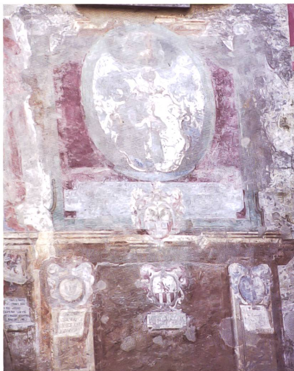
Bild 26: Die Aufnahme zeigt oben das Wappen des Podestà Salomon Buol, in der Mitte das kleine Wappen eines Kanzlers Quadrio, unten in der Mitte das Wappen des Giovanni Agostino Chinali, links jenes des Gaudenzio Misani und rechts jenes des Kanzlers Ulrich Buol.

Das kleine Wappen Quadrio ist im Rahmen der Buol-Inschrift platziert. Demnach wird es sich um den Kanzler des Podestà handeln. Wappen: «Geteilt, oben in Gold schwarzer Adler, unten in Rot drei silberne Quader (2,1).» Quadrio: adelige Veltliner Familie, besonders in Ponte und Tirano vertreten.