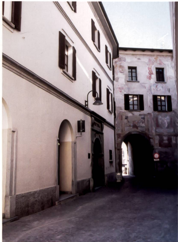
Bild 30: Seitenansicht des Pretorios von Tirano mit der Porta Poschiavina. Hinter dem vergitterten Rundtor mit der Überschrift PRETURA befindet sich ein Mauergerölbe mit attraktiven Wappenfresken.

Das Gebäude reicht von der Porta Poschiavina bis zur Piazza Cavour zurück. Der Palazzo, so wie er heute aussieht, wurde im Laufe der Zeit umgebaut und renoviert. Architektonisch weist er eine gewisse Ähnlichkeit mit dem Pretorio von Morbegno auf, auch der Umbau scheint ähnlich verlaufen zu sein. Auffallend sind beispielsweise die drei runden Tore im Erdgeschoss. Auch der Palazzo del Podestà in der Via Roma in Bormio zeigt gewisse architektonische Parallelen.