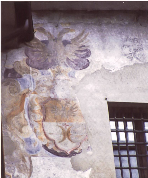
Bild 23: Wappen des Paul Jenatsch, Sohn des 1639 ermordeten Georg Jenatsch. Stemma di Paul Jenatsch, figlio dell'assassinato Georg Jenatsch nel 1639.