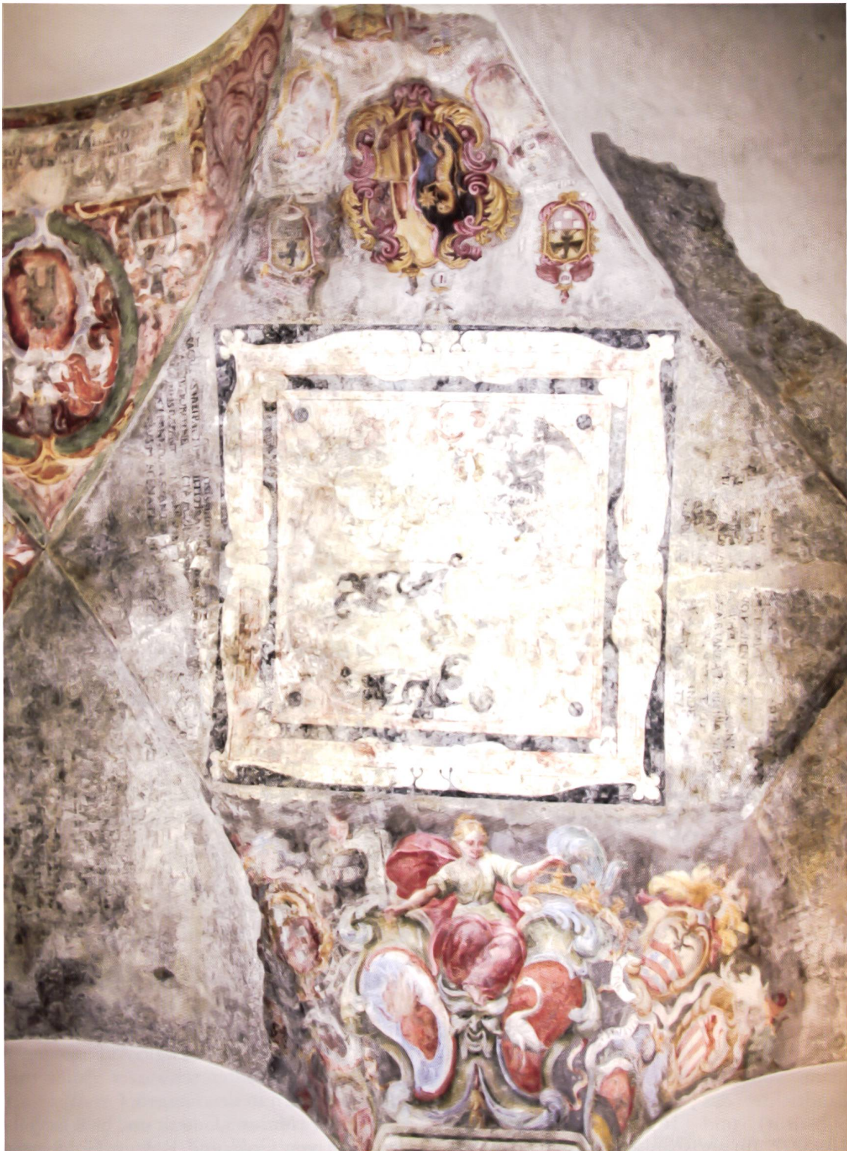
Bild 32: Bildausschnitt im Gewölbescheitel mit einem unbekanntem Allianzwappen in einem quadratischen Rahmen. Rund um das Scheitelwappen sind weitere Fresken erkennbar: Oben links das Wappen della Torre, oben Mitte das Allianzwappen Tini-a Marca, unten Mitte die Justitia mit den Wappen Frisch und Paravicini, unten rechts die Wappen Lambertenghi, Chinali und Lazzaroni.

Frammento sulla sommità della volta di uno stemma d'alleanza non decodificato, racchiuso in una cornice quadrata. Attorno sono altri stemmi ben riconoscibili: in alto a sinistra quello dei della Torre, al centro, sempre in alto, lo stemma d'alleanza Tini-a Marca, in basso nel mezzo, la Giustizia con gli stemmi Frisch e Paravicini e a destra quelli dei Lambertenghi, Chinali e Lazzaroni.