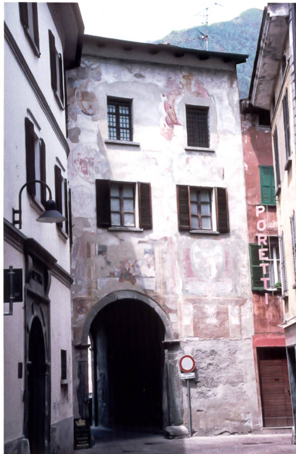
Bild 20: Innenseite der Porta Poschiavina . In diesem Bereich sind zahlreiche Wappen vorhanden, die meisten davon jedoch stark verwittert. Zudem wurden etliche durch Ausbrechen oder Vergrössern von Fenstern arg beschädigt. Links ist das Pretorio von Tirano erkennbar.

Parte interna della Porta Poschiavina. Qui sono visibili molti stemmi, la maggior parte dei quali fortemente rovinata dagli agenti atmosferici. Altri furono danneggiati dalla realizzazione o dall'ingrandimento delle finestre. A sinistra il Pretorio di Tirano.