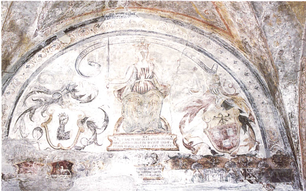
Bild 29: Lünette an der Ostwand. Das Fresko wurde 1553 zu Ehren des Podestà Antonio Planta erstellt. Links und rechts der Justitia stehen die Wappen Planta und Quadrio. Das Fresko hat mehr als 450 Jahre überlebt und ist das älteste Wappen der Porta Poschiavina und des Pretorios von Tirano.

Lunetta sulla parete est. L'affresco venne dipinto nel 1553 in onore del podestà Antonio Planta. A sinistra e a destra della Giustizia sono dipinte le insegne dei Planta e dei Quadrio. L'affresco, che ha più di 450 anni, è il più antico della Porta Poschiavina e di tutto il palazzo Pretorio di Tirano.