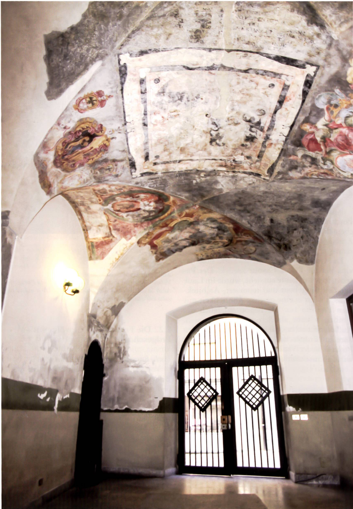
Bild 31: Pretorio von Tirano. Bemaltes Gewölbe mit Wappenfresken aus der Zeit der Bündner Herrschaft. Das Deckengemälde wurde kunstgerecht restauriert und die einzelnen Wappen sind farbenprächtig. Pretorio di Tirano. Volta dipinta con le insegne della signoria dei Grigioni. Tutto il soffitto venne restaurato a regola d'arte e tutte le insegne sono di eccellente colore.