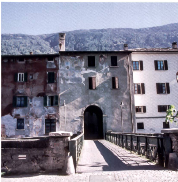
Bild 19: Aussenseite der Porta Poschiavina am Ufer der Adda. Hier haben sich nur wenige Fresken erhalten. Parte esterna della Porta Poschiavina sulle rive dell'Adda con i pochi affreschi conservati.

Die Porta Poschiavina wurde 1492 auf Anordnung Ludwigs des Mohren, des Herzogs von Mailand, aus der alten Stadtmauer ausgebrochen. Die zahlreichen Wappenfresken, die am Pretorio und an der Porta Poschiavina im Laufe der Zeit angebracht worden waren, wurden auch hier beim Aufstand von 1797 von den Cisalpini entfernt oder übermalt. Anlässlich der Restaurationsarbeiten von 1933 und 1987/88 konnten diese z. T. wieder freigelegt werden. 52 Die nächsten zwei Bilder zeigen die Porta Poschiavina von beiden Seiten.