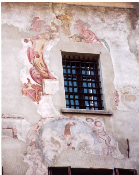
Bild 25: Wappenfragmente im Bereich des oberen rechten Fensters der Porta Poschiavina. Das Bild zeigt zwei Wappenreste Buol und Planta sowie zwei kleine Wappen Sprecher v. Bernegg und Vicedomini.

Stemmi e frammenti presso la finestra a destra della Porta Poschiavina: i frammenti delle famiglie Buol e Planta e le due piccole insegne delle famiglie Sprecher v. Bernegg e Vicedomini.