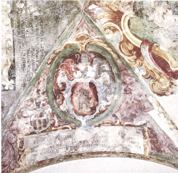
Bild 33: Wappen des Caspar della Torre und des [Cancelliere] Chinali. Die Inschrift befindet sich im unteren Rechteckrahmen. Stemma di Caspar della Torre e del {cancelliere} Chinali. L'iscrizione si trova nella cornice inferiore del rettangolo.