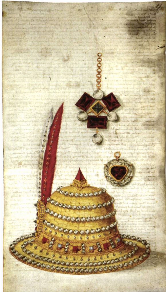
Abb.1: Beutestücke der Basler aus der Schlacht von Grandson in Bild und Text, Aquarell auf Pergament, Augsburg um 1545, 465 x 255 mm, Historisches Museum Basel, Inv.-Nr. 2007.511.

Herzog Karl der Kühne war einer der reichsten Fürsten, sein Hof war einer der glanzvollsten Europas. Er hatte grosse Pläne, scheiterte jedoch an seinem Ehrgeiz. In den Schlachten von Grandson und Murten (1476) unterlag er