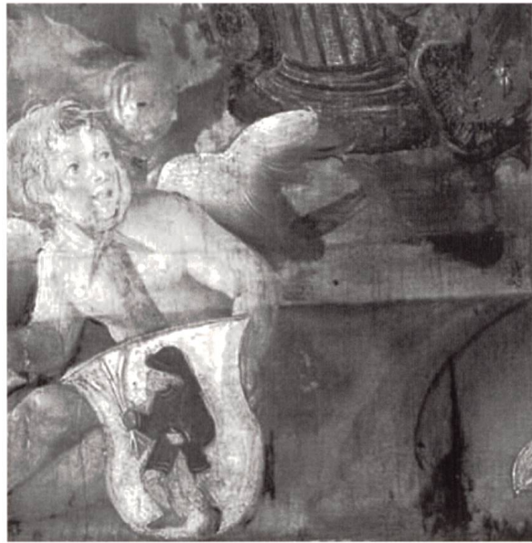
Infrarotreflectogramm Unterzeichnung Engelsgesicht Korrektur Kopfkontur