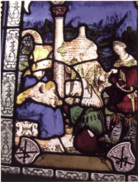
Glasfenster, datiert 1522, Anbetung der Könige, Stadtkirche Bad Wimpfen (eine Stiftung des Konrad Korbeir/Kober und seiner Ehefrau Agatha Bameni/Baumann).

gründlich durchleuchtet. So wurden beispielsweise die Unterzeichnungen, mit denen der Künstler das Gemälde vorbereitet hatte, mit Infrarotstrahlen (mit unterschiedlichen Wellenlängen durch die Inframetrix IR-Kamera und den digitalen Phase-1-Fotohintergrund) sichtbar gemacht.