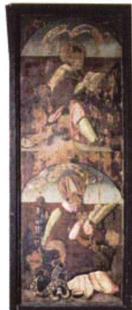
Altarflügel verso Württembergischen Landesmuseum, Stuttgart

Im Jahr 2005 reiste die Verfasserin erneut zur Evangelischen Stadtkirche in Wimpfen, in der Vogtherr von 1522 bis 1525 tätig war.