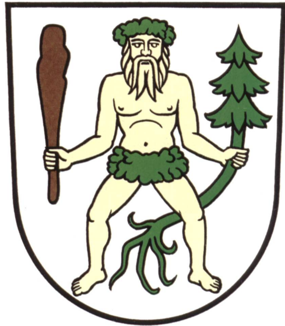
Ill. 13: Gemeindewappen von Grabs, Zeichnung von Fritz Brunner Armoiries de la commune de Grabs, dessin de Fritz Brunner

Das aus der Glarnerzeit stammende Fridolinswappen an der Aussenmauer, welches in den zwanziger Jahren des letzten Jahrhunderts renoviert worden war (Ill. 4), wurde 1978 bei der gänzlichen Instandstellung des Schlosses durch das weisse Wappen mit der schwarzen Kirchenfahne der Werdenberg ersetzt. Im ersten Stock befindet sich eine grosse Halle mit einer nach dem Brand von 1695 erneuerten Balkendecke. An den Wänden sind Wappen von Glarner Landvögten aufgemalt, die 1925 stark aufgefrischt und teilweise auch erneuert wurden (Ill. 5). Die Inschriften und Jahreszahlen beziehen sich auf die feierliche Amtseinssetzung des Vogtes, den sogenannten Aufzug,