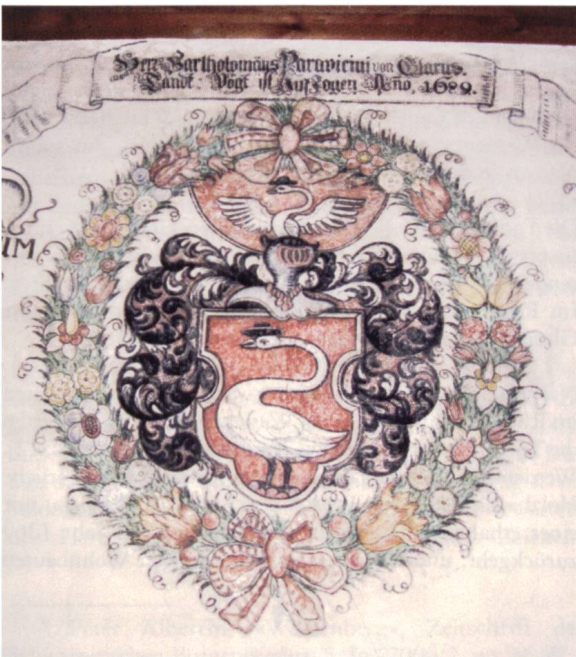
Ill. 9: Wappen des Landvogtes Barthlome Paravicini de Capelli Les armoiries du bailli Barthlome Paravicini de Capelli