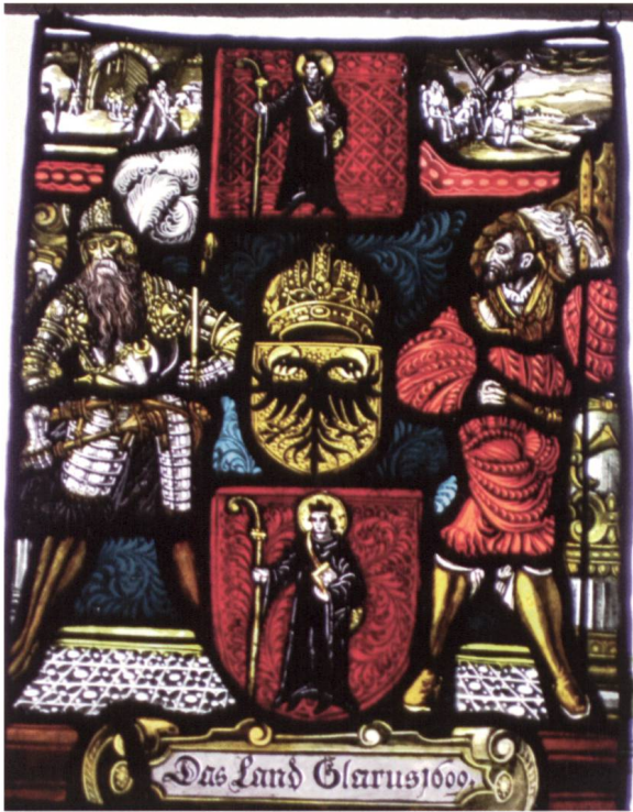
Ill. 11: Glarner Standesscheibe, 1609 Vitrail d'Etat de Glaris, 1609