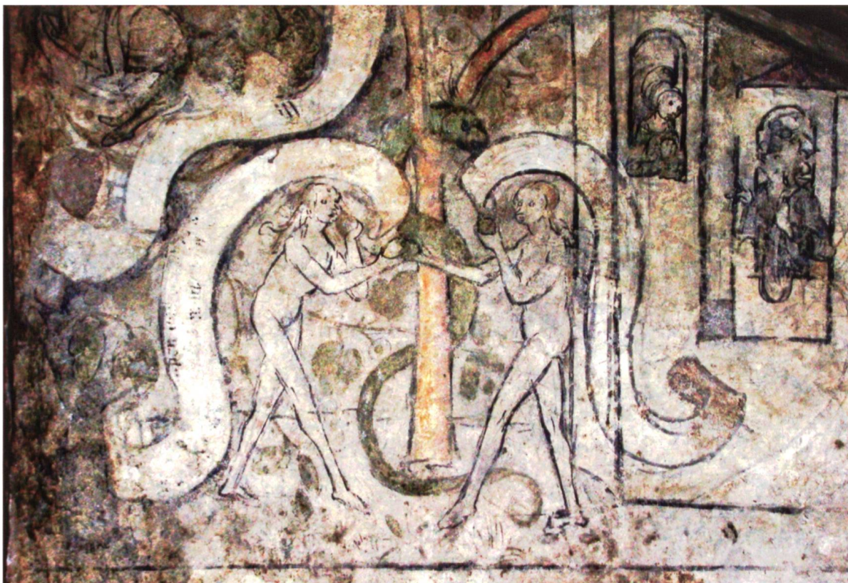
Ill. 24: Alte Burgkapelle in der Schattenburg, spätgotisches Fresko mit Adam und Eva, um 1490/1500 Peinture murale: Adam et Eve, env. 1490/1500, dans l'ancienne chapelle au château de «Schattenburg»

Wie wir gesehen haben, zeigt das Wappen von Feldkirch in Silber eine dreilätzige schwarze Kirchenfahne. Die offizielle Verleihung des Wappens durch die Vorarlberger Landesregierung erfolgte jedoch erst am 22. Januar 1930. Es handelt sich dabei um die Bestätigung des traditionellen Wappens der Herrschaft Montfort-Feldkirch, wie es von der Stadt spätestens seit dem 16. Jahrhundert neben einem anderen Wappen im Siegel geführt wurde. Das ältere Wappen, seit 1330 belegt, zeigt eine Kirche mit Mittel- und Seitenschiff und einen hohen viereckigen Turm. Ein in aller Form redendes Wappen. Dabei ist das Dach des Turmes auf beiden Seiten überhängend und hat auf jeder Seite ein kleines Spitztürmchen, die Mittelspitze zierte auf einem Knauf ein Kreuz. An der linken Hüftstelle des Wappens befindet sich ein kleiner Schild, darauf die Fahne der Grafen von Montfort. In dieser Form erscheint das Feldkircher Wappen noch im alten Vorarlberger Landeswappen vom 20. August 1864, welches bis 1918 gültig war 14 .