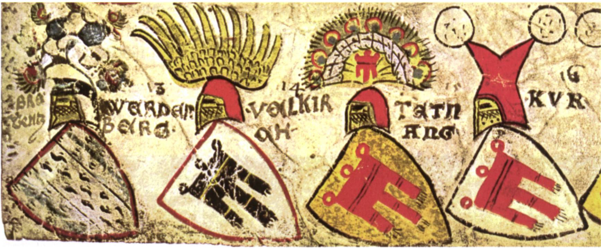
Ill. 3: Ausschnitt aus der Vorderseite vom Pergamentstreifen II aus der Zürcher Wappenrolle (Merz & Hegi) mit den Wappen Bregenz, Werdenberg, Feldkirch und Tettang Détails du recto du parchemin n° II du rôle d'armes de Zurich (Merz & Benteli) avec les armoiries de Bregenz, Werdenberg, Feldkirch et Tettang

in der um 1340 entstandenen Zürcher Wappenrolle 2 an prominenter Stelle aufgeführt (Ill. 3). Nach dem Wappen der Grafen von Bregenz mit dem Hermelinpfahl in Kürsch 3 folgt Werdenberg mit einem schwarzen Gonfalon in Silber, dann Feldkirch mit einem roten Gonfalon in Gold und Tettang mit einer solchen dreilätzigen Kirchenfahne in Rot auf Silber. 1258 kam es zur Erbteilung, es entstanden die Häuser Montfort und Werdenberg, wobei sich beide Geschlechter mit der Zeit weiter aufsplitterten. Die wichtigsten Werdenberger Linien waren die Werdenberg-Heiligenberg und Werdenberg-Sargans. Die Werdenberger verdankten ihren Erfolg der engen Bindung an das Haus Habsburg, der Streit um das Rheintal zwischen den Eidgenossen und Österreich aber läutete den Niedergang der Grafen von Werdenberg gegen Ende des 14. Jahrhunderts ein.