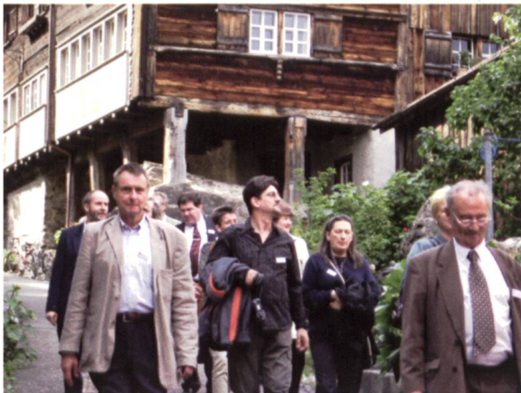
Ill. 12: Die Teilnehmer im Städtchen Werdenberg Les participants dans la ville de Werdenberg

der es der Öffentlichkeit zugänglich machte und darin das Rheinmuseum und die kantonale Waffensammlung unterbrachte.