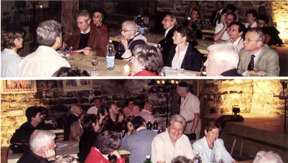
Ill.1 und 2: Generalversammlung im Kellergewölbe des Schlosses Werdenberg Pendant l'assemblée générale dans la cave du château de Werdenberg