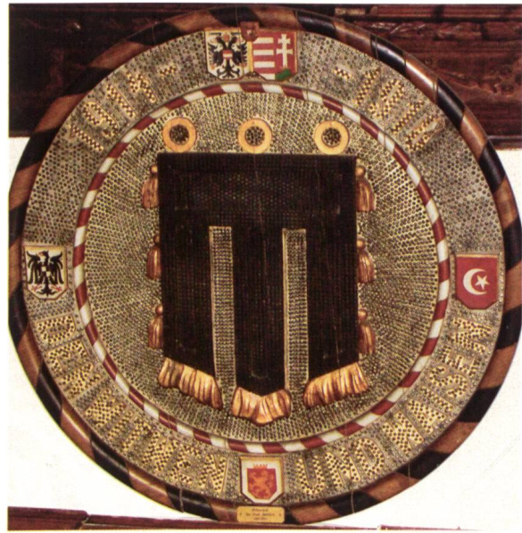
Ill. 22: Wehrschild aus dem Ersten Weltkrieg im Ratssaal des Rathauses Rondache datant de la 1 ère Guerre Mondiale dans la salle du conseil de l'hôtel de ville

der Torwächter selbst wohnte in einem kleinen, naheliegenden Haus. Durch das Churertor führte die wichtige Handelsstrasse über die Heiligkreuzbrücke, den einzigen Übergang über die Ill in Feldkirch, nach, der Name lässt es erahnen, dem bündnerischen Chur 10 .