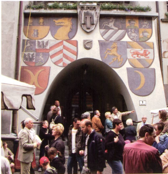
Ill. 21: Fassade des Feldkircher Rathauses mit Wappen von Feldkircher Familien Façade de l'hôtel de ville de Feldkirch avec des armoiries de familles bourgeoises