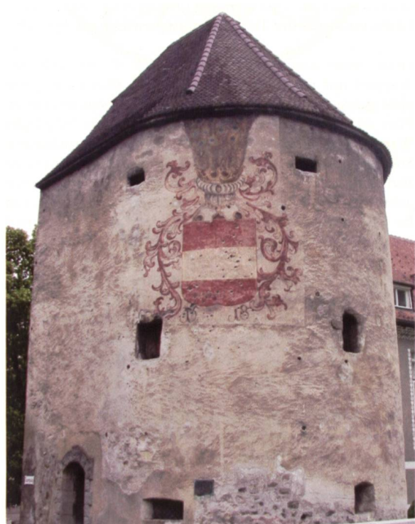
Ill. 20: Wasserturm an der Ill, welcher als Verstärkung für die Stadtmauer erbaut wurde La «tour de l'eau» sur l'Ill, construite en 1482 pour renforcer les murailles de la ville

Unsere erste Station in der Altstadt war das so genannte Churerort. Vor 1270 erbaut, wurde das Churerort im Zuge der Neubefestigung der Stadt 1491 von Grund auf erneuert. Ein dem sechsgeschossigen Torturm vorgelagertes, 1591 errichtetes Vorwerk wurde bei der Einebnung der Stadtgräben nach 1826 abgetragen. Das Churerort ist heute das einzige erhalten gebliebene turmartige Stadttor im Vorarlberg.