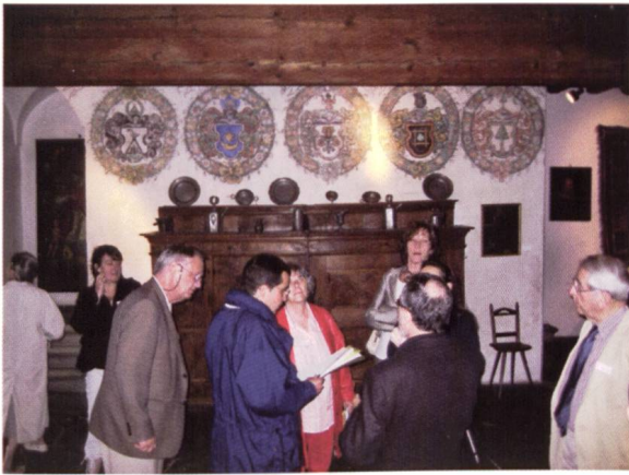
Ill. 5: Die Teilnehmer in der Halle mit den Wappenmalereien Les participants dans la salle aux armoiries peintes