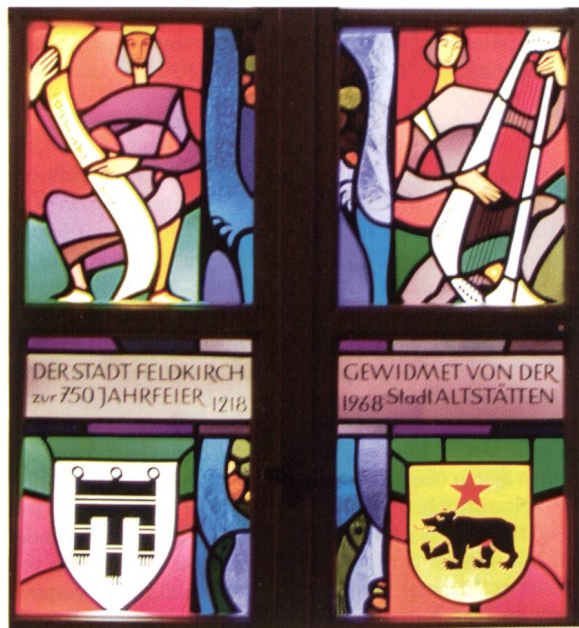
Ill. 23: Glasfenster von 1968 im Rathaus mit den Wappen von Feldkirch und Altstätten Vitrail de 1968 avec les armoiries de Feldkirch et d'Altstätten dans l'hôtel de ville

Im Innern nun gab es eine ganze Vielfalt von kunsthistorischen Schätzen. Zwei Objekte, welche sich im Ratssaal befinden, sollen hier speziell erwähnt werden. Der Wehrschild (Ill. 22) erinnert an die Not des Ersten Weltkrieges. Er ist geschmückt mit dem Stadtwappen sowie den Wappen der damals verbündeten Staaten Österreich-Ungarn, Deutschland, Bulgarien sowie der Türkei. Der Wehrschild befand sich zwischen 1914 und 1918 in der Marktgasse in einer Holzhütte. Nach dem Tode eines Soldaten konnten Freunde und Bekannte Nägel erwerben und sie in den Schild schlagen. Der Verkaufserlös kam in einen Hilfsfonds, welcher Witwen und Waisen der Gefallenen unterstützte 12 .