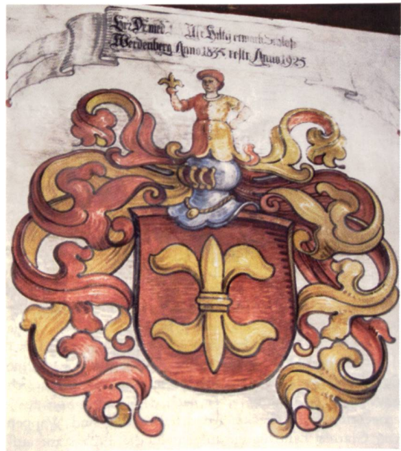
Ill. 10: Familienwappen Hilty Armoiries de la famille Hilty