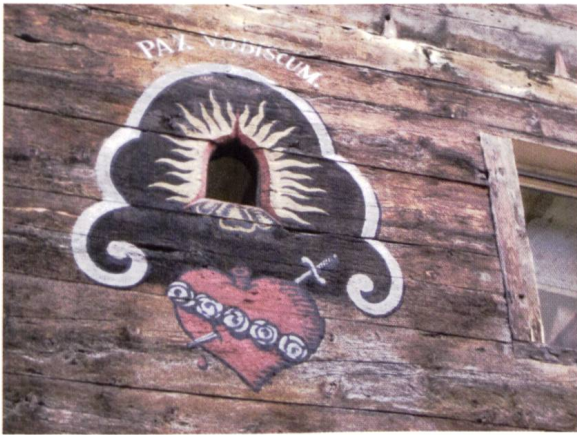
Ill. 14: Seelenfensterchen in einer Hauswand in Werdenberg Fenêtre des âmes dans une maison de Werdenberg

aus Holz ab 1342 6 . Werdenberg gehörte zur Pfarrgemeinde Grabs und ist heute Teil der politischen Gemeinde Grabs.