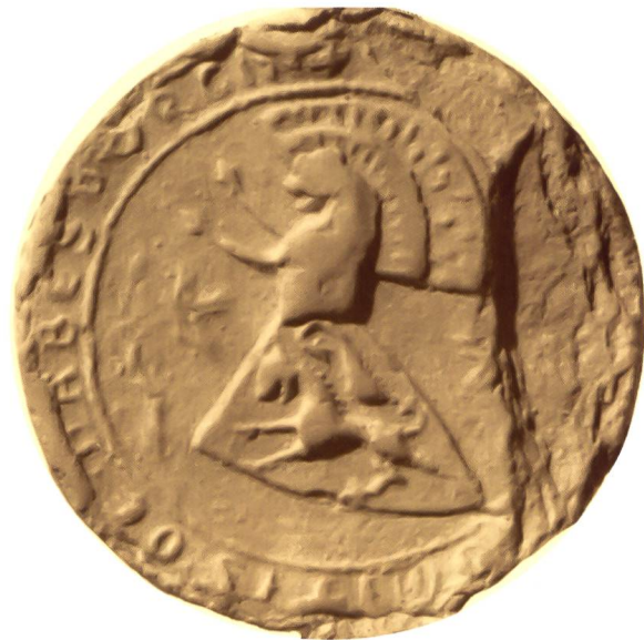
Abb. 2: Siegel des Grafen Eberhart I. von Habsburg-Laufenburg aus dem Jahre 1273. Aus: Corpus Sigillum Helvetiae, 1968, Tf I.

«Er war groß von Gestalt, mit langen Beinen, feingliedrig, mit kleinem Kopf, blassem Gesicht und