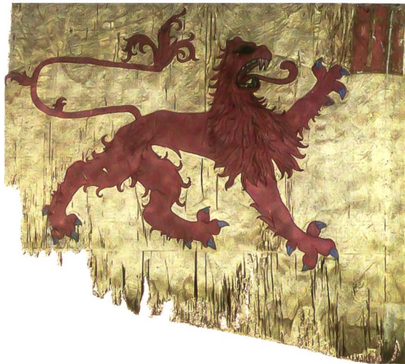
Abb. 6: Grafschaftsbanner von Willisau um 1479. Aus: Mühlemann, Gemeinden, S. 29.

mit einem gemeinsamen Siegel, welches St. Petrus, den Amtspatron, auf dem Sessel sitzend mit dem Himmelschlüssel darstellt, zu seinen Füßen der Schild mit dem Löwen. Die Inschrift dieses Siegels: + COMTATUS + ET + OPIDI + WILLISOW + (Abbildung 5).