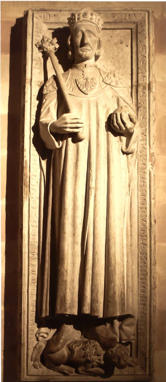
Abb. 3: Grabplatte König Rudolfs I. von Habsburg im Dom von Speyer. Foto R. Kälin, 2011.

auch die farbige Darstellung des Helmkleinods: Wachsender roter Löwe, am Rücken ein silberner Kamm, welcher mit Pfauenfedern besteckt ist (Abbildung 4).