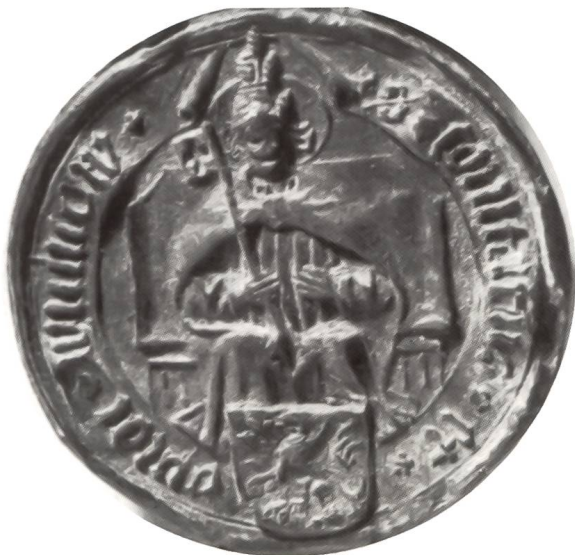
Abb. 5: Siegel der Stadt und Grafschaft Willisau um 1514. Aus: Reinle, Kunstdenkmäler, S. 229.

Österreich wurden, übernahmen sie auch das rot-weiss-rote Landeswappen, den Bindenschild. Dieser wurde in den nachfolgenden Jahren immer mehr zum eigentlichen Wappen der Dynastie. Bereits Friedrich III. der Schöne hatte den Bindenschild auf die Brust des Reichsadlers gelegt. Damit trat das alte Stammwappen der Grafschaft Habsburg immer mehr in den Hintergrund.