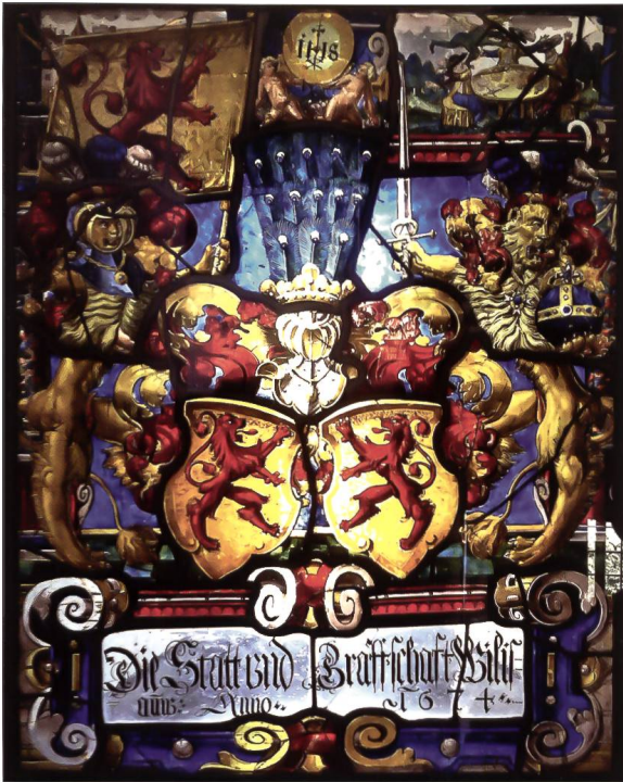
Abb. 7: Wappenscheibe der Stadt und Grafschaft Willisau aus dem Jahre 1674 im Treppenaufgang des Landvogteischlosses Willisau mit Allianz-Löwenwappen, österreichischer! Helmzier, Schildhaltern sowie weiteren Details, wie zum Beispiel rechts oben die Spielerszene aus der Heilig-Blut-Legende.

Juli 1512 der Grafschaft Willisau auf Bitte des Landvogtes Melchior zur Gilgen für die dem Papst Julius II. geleistete Hilfe das Recht, über dem Löwen das Kreuz Christi und die päpstlichen Schlüssel im Panner zu führen. Von diesem Pannerbrief machte das Amt aber erst 1599 mit Bewilligung des Rates von Luzern Gebrauch. 18 Diese Ehrenzeichen gerieten allerdings später wieder in Vergessenheit. 19