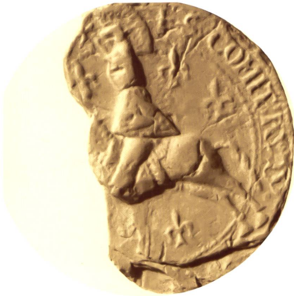
Abb. 1: Siegelfragment des Reitersiegels Graf Rudolfs IV. von Habsburg aus dem Jahre 1270.

Fragment seines zweiten Reitersiegels stammt aus dem Jahre 1270. Der steigende Löwe ist auf dem Schild leider nur noch schemenhaft erkennbar. Umschrift des Siegels + S . COMIT' . RVD' . / dE HABESB' LATGRAVII . ALSATIE (Sigillum comitis Ruodolfi de Habesburg lantgravii Alsatie). (Abbildung 1).