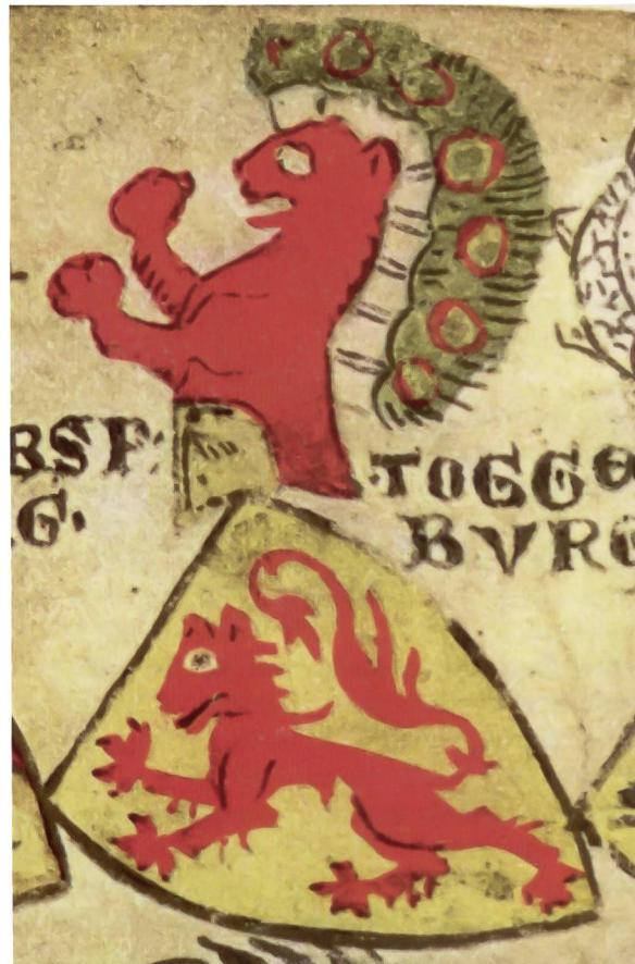
Abb. 4: Wappen derer von Habsburg in der Zürcher Wappenrolle von ca. 1335/45. Aus: Hegi/Merz, 1930, Tafel V.

Richental 12 beispielsweise gibt in Weiss einen gelb-bewehrten roten Löwen. Gelegentlich erscheint der Löwe auch gekrönt. 13