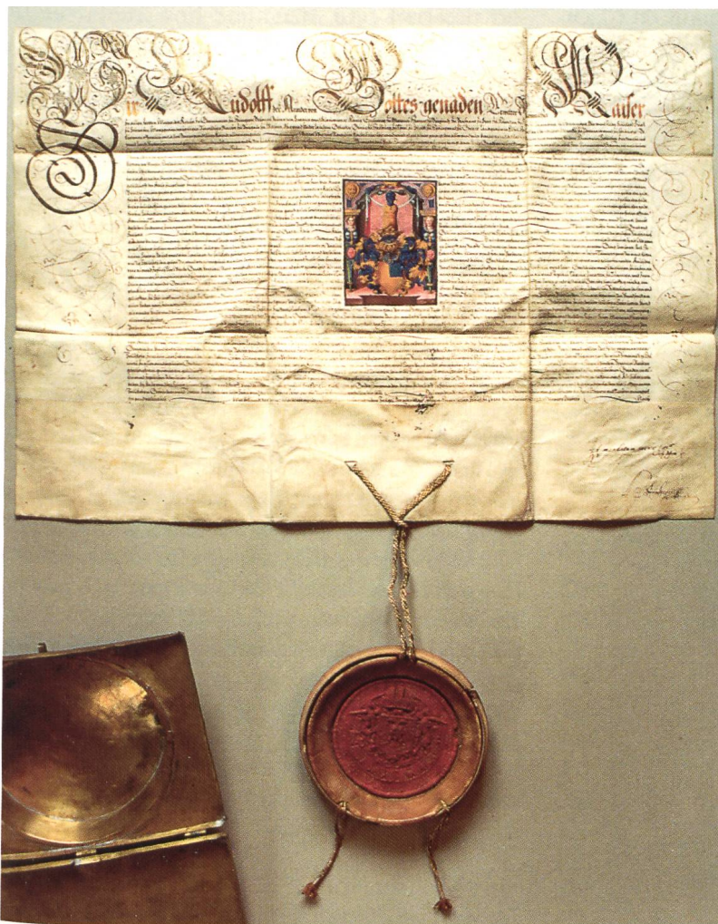
Abb.: Adelsbrief mit Siegel

erfolgreich, daran teilnehmen zu dürfen 4 , wovon der zollikofer'sche Adelsbrief von 1578 5 beredtes Zeugnis ablegt: