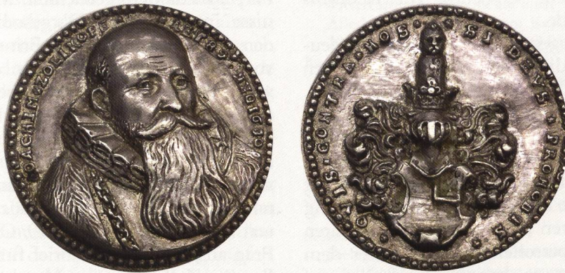
Abb. 5: Exemplar SNM: LM 6124. AR, 46,85 mm, 72,69 g. ↑↑