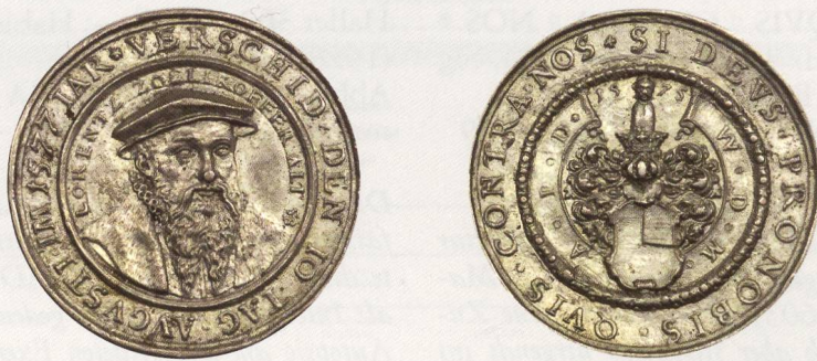
Abb. 1a: Exemplar SNM: LM 4408. AR, 39,09 mm, 16,68 g. ↑↑