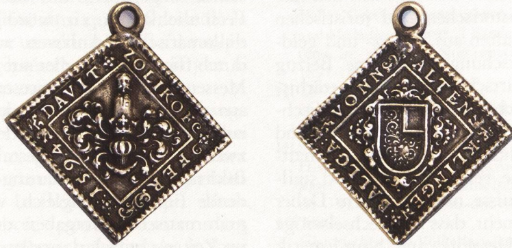
Abb. 4: Exemplar SNM: LM 4198. AR, 29,35 x 28,8 mm, 16,64 g. ↑↑