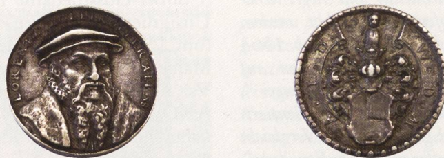
Abb. 1b: Exemplar SNM: LM AB 3840 (Legat Bally). AR, 27,0 mm, 8,52 g. ↑↑