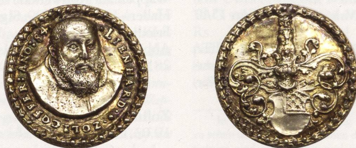
Abb. 3: Exemplar SNM: LM 6316. AR, 35,05 mm, 16,85 g. ↑↑