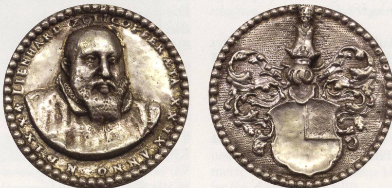
Abb. 2: Exemplar SNM: EA 837. AR, 46,65 mm, 36,92 g. ↑↑