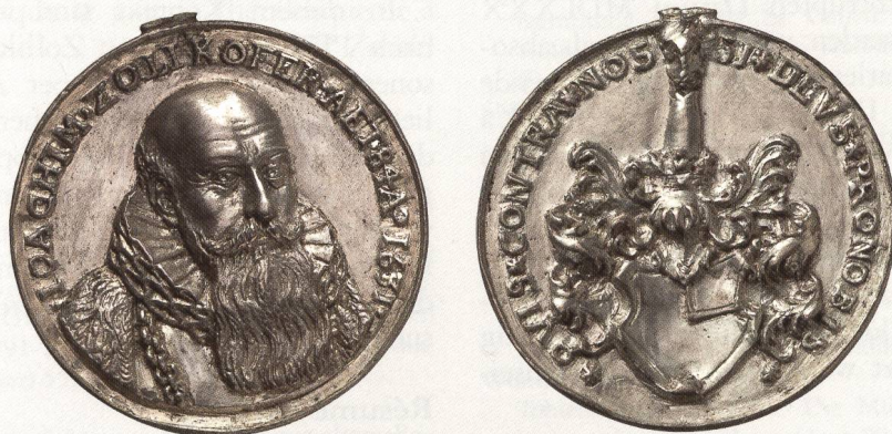
Abb. 6: Münzkabinett Winterthur, Inv.Nr. Md 2619. AR, 46,47 mm, 36,04 g. ↑↑

Rs. * SI DEVS * PRONOBIS * - * QVIS * CONTRA * NOS, das behelmte und gemehrte Vollwappen.