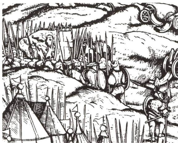
Fig. 6 Der Weiß Kunig , Bataille de Gradisca (détail), Vienne, Nationalbibliothek.

d'or passant est représenté sur champ rouge et la croix d'or tenue verticalement par la patte droite de l'animal (fig. 5) 13 .