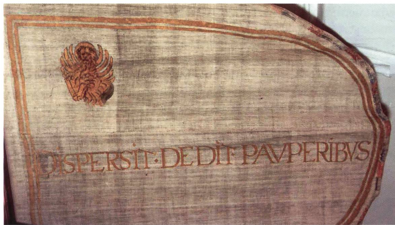
Fig. 1 Drapeau vénitien.