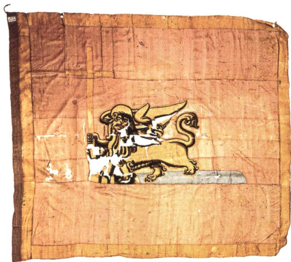
Fig. 5 Drapeau du navire de Capodistria (Koper) à la bataille de Lépante (Aldrighetti, L'araldica e il leone di San Marco , p. 106).