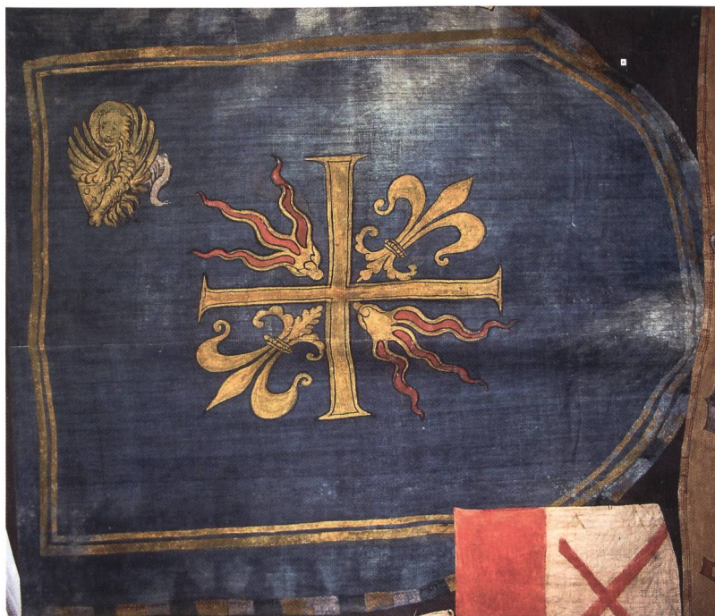
Fig. 2 Drapeau du marquis del Monte Santa Maria.

l'affrontement, coupèrent les rênes des chevaux ennemis, lesquels, désormais hors de contrôle, mirent le désordre dans leurs propres rangs, entraînant la défaite aragonaise 4 .