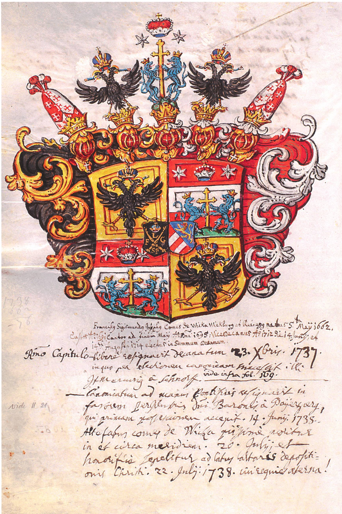
Fig. 4 – Armoires de François Sigismund Joseph, comte de Wicka, Liber Vitae du Chapitre de la cathédrale de Bâle, f° 128 v°, Musée jurassien d'Art et d'Histoire à Delémont.