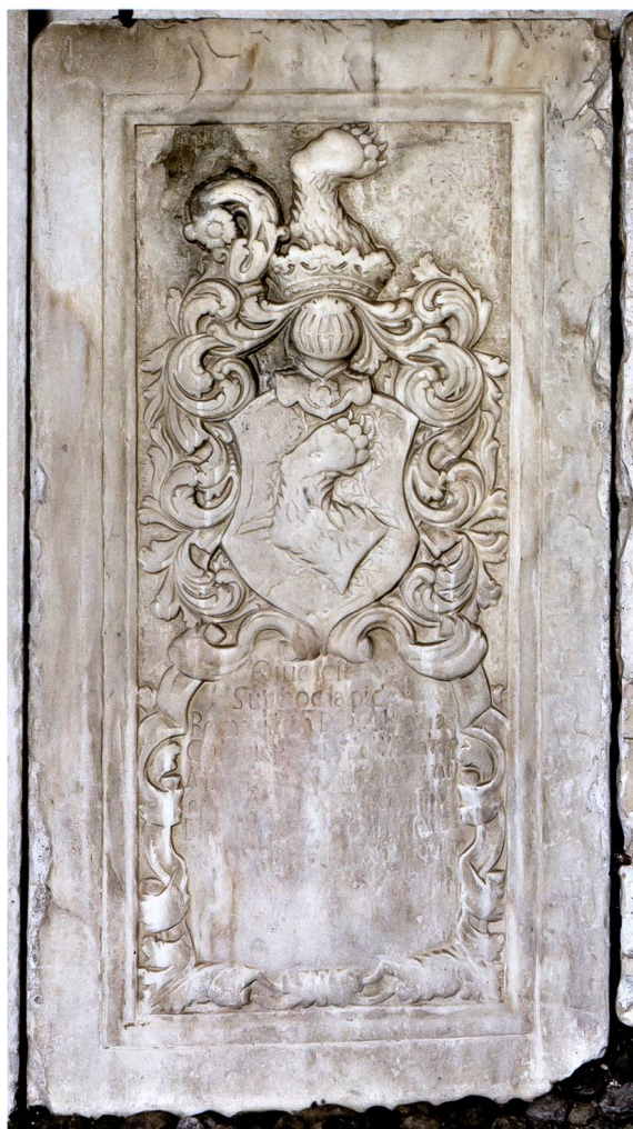
Bild 3: Grabdenkmal für Äbtissin Regina Catharina von Planta-Wildenberg (1711–1733).

Wappenbeschreibung: In [Silber schwarze] Bärenatze. – Helmzier: Aus [goldener] Krone das Schildbild wachsend, beseitet von Krummstab.