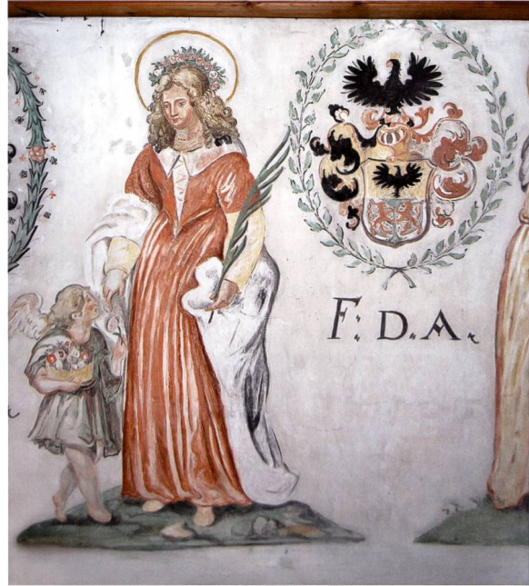
Bild 21: Wappen der Äbtissin Dorothea de Albertis (1666–1686) im Vorsaal des Fürstenzimmers.

Wappenbeschreibung: Geviert, 1 und 4 in Silber Johannes der Täufer mit Kreuz und Osterlamm, 2 und 3 geteilt von Schwarz und Silber, in Schwarz zwei silberne Schachfiguren, in Silber eine schwarze Schachfigur. – Ovaler Schild überhöht von goldenem Krummstab.