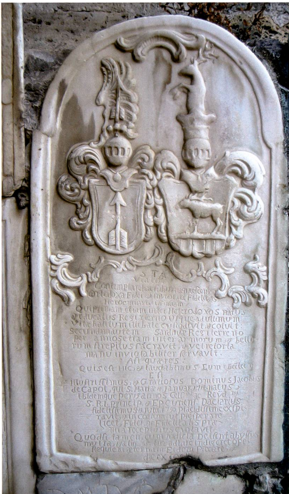
Bild 9: Grabmal für Jacob von Capol mit Allianzwappen Capol-Gross (1714–1790).

Wappen Capol: «In [Schwarz] steigender [goldener] Pfeil. – Helmzier: Auf [goldener] Krone [schwarzer] Flug, belegt mit dem Schildbild.»