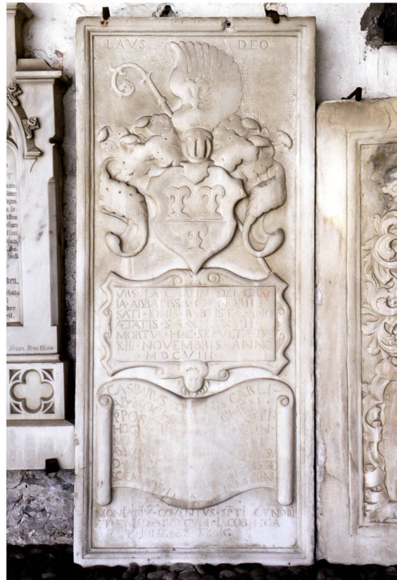
Bild 1: Grabdenkmal für Äbtissin Ursula IV. Carl von Hohenbalken (1599–1608).