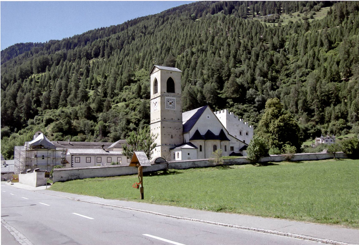
Kloster St. Johann Müstair/UNESCO Welterbe.