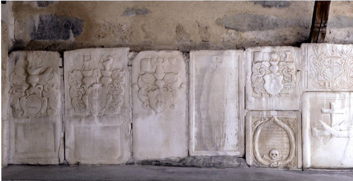
Grabplatten an der Westseite des Turmes.