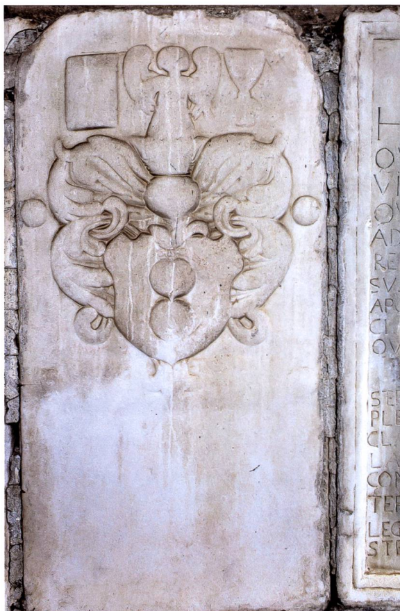
Bild 10: Grabmal für Pfarrer Dr. Caspar Platz aus Savognin mit Wappen Platz (1651–1691).