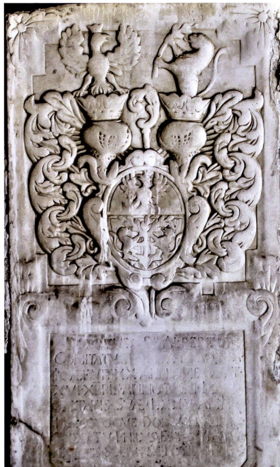
Bild 2: Grabdenkmal für Äbtissin Dorothea de Albertis (1666–1686).

Wappenbeschreibung: In [Silber] zwei [rote] Löwen, den Stamm eines [grünen] entwurzelten Baumes stützend. Im [goldenen] Schildhaupt [schwarzer] flugbereiter und [gold] gekrönter Adler. Schild von Krummstab überhöht. – Helmzier: Rechts auf [goldener] Krone [schwarzer] flugbereiter und [gold] gekrönter Adler, links aus [goldener] Krone [roter] Löwe wachsend, einen [grünen] Zweig in den Pranken haltend.