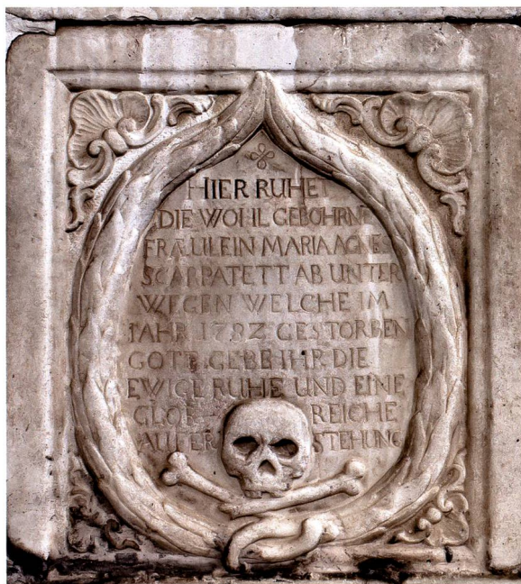
Bild 13: Grabmal für Maria Agnes Scarpatetti von Unterwegen, † 1782.