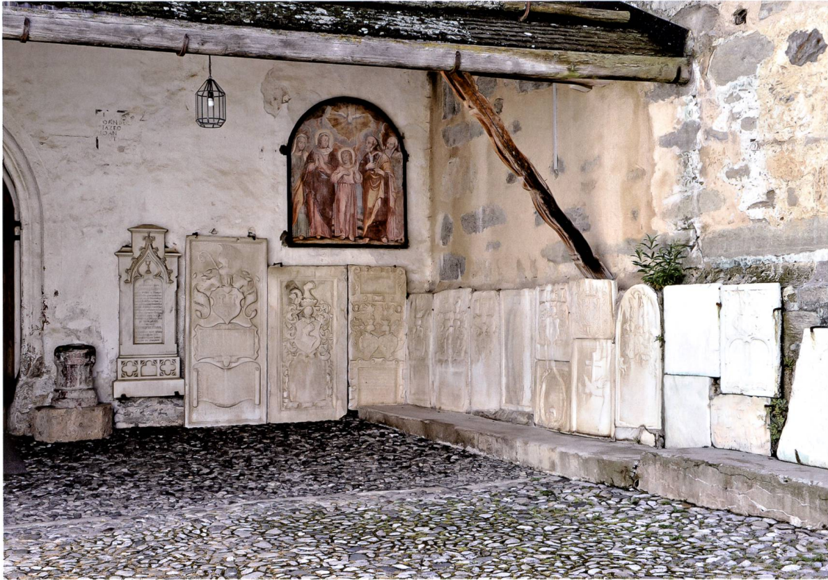
Übersicht der Grabplatten.