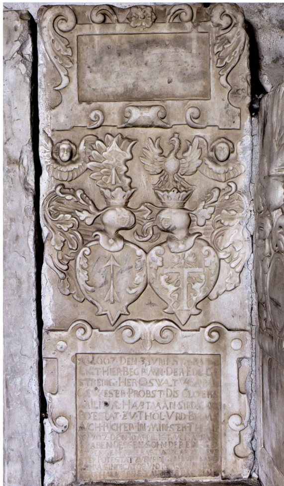
Bild 7: Grabdenkmal für Oswald und Sebastian von Capol mit Allianzwappen Capol-Imeldi.

Wappen Capol: In [Schwarz] steigender [goldener] Pfeil. – Helmzier: Auf [goldener] Krone [schwarzer] Flug, belegt mit dem Schildbild.