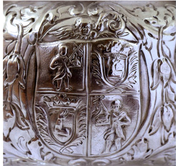
Bild 22b: Wappen der Äbtissin Regina Catharina von Planta-Wildenberg (1711–1733) auf silbernem Rauchfass im Kloster Müstair.

Wappenbeschreibung: Geviert, 1 und 4 Johannes der Täufer mit Kreuz und Osterlamm, 2 und 3 gekröntes und bekröntes Plantawappen