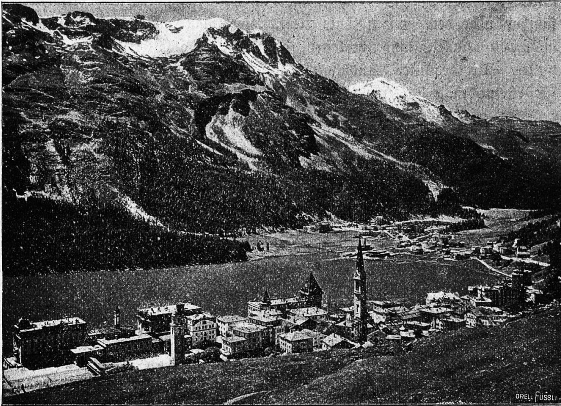
St. Moritz.

fort eingerichtet ist, ferner das Kurhaus Viktoria, du Lac und eine Reihe recht guter Hotels zweiten Ranges. Doch der letzte Platz ist bereits besetzt, wie ich mit meiner Staatskarosse angefahren komme. Das macht mir weiter keine Sorge, denn wenn alle Stricke reißen sollten, bin ich bald in Celerina oder Samaden, wo sich wohl noch ein Unterschlupf finden wird. Doch ziehe ich vor, in St. Moritz bei guten Bekannten den Abend zuzubringen; denn das einzig langweilige auf solchen Touren sind die Abende in Gegenden, wo man niemand kennt. Da, am äußersten Rand von St. Moritz, tut sich mir noch eine recht gute Herberge auf, ein nettes Zimmer wird bezogen, das Velo in der Remise unter-, und der Mann mit Bürste, Seife und einem ordentlichen Abendessen wieder in die Höhe gebracht.