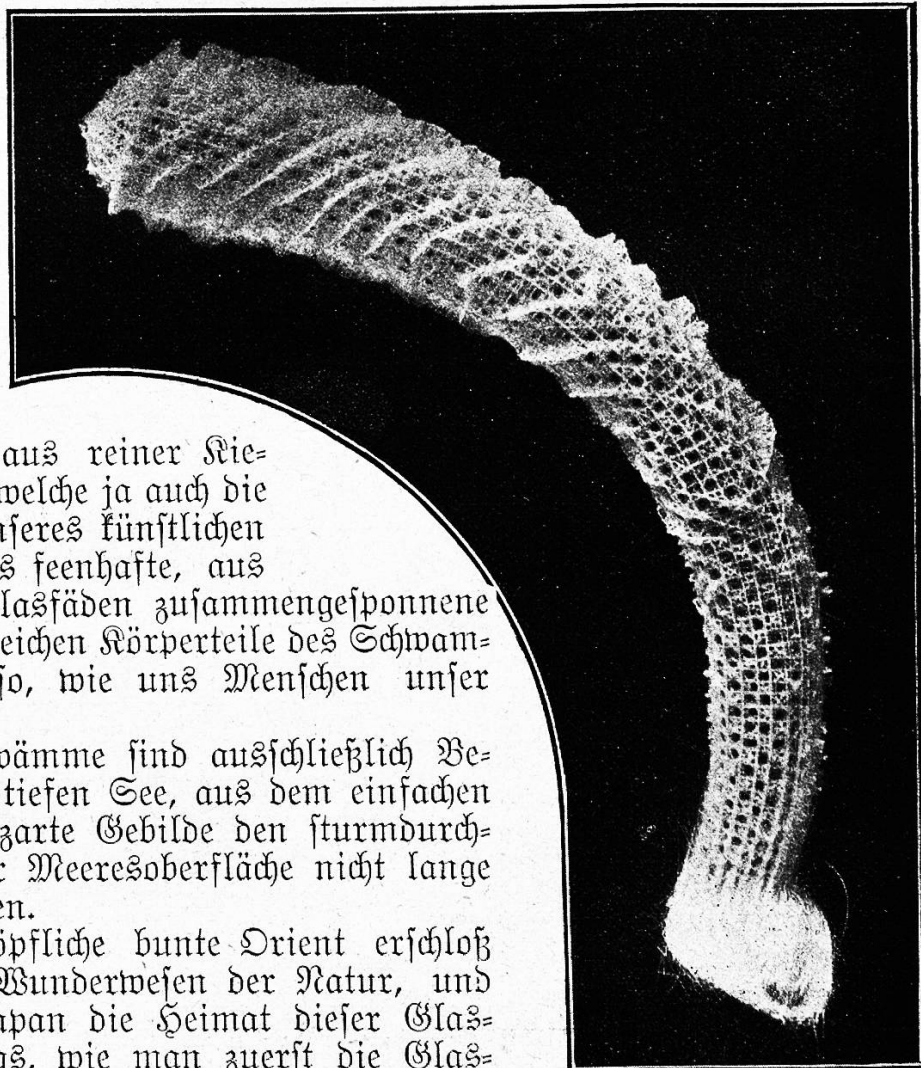
Ein wunderbares Naturgewebe (Glasschwamm.)

Der unerschöpfliche bunte Orient erschloß uns zuerst diese Wunderwesen der Natur, und noch heute ist Japan die Heimat dieser Glaskünstler. Anfangs, wie man zuerst die Glasschwämme zu Gesicht bekam, glaubte man es nicht mit einem Tier, sondern mit Glasbläserkunst-