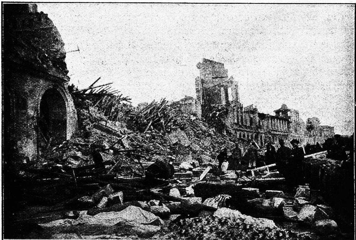
Messina: Hafen-Partie I.