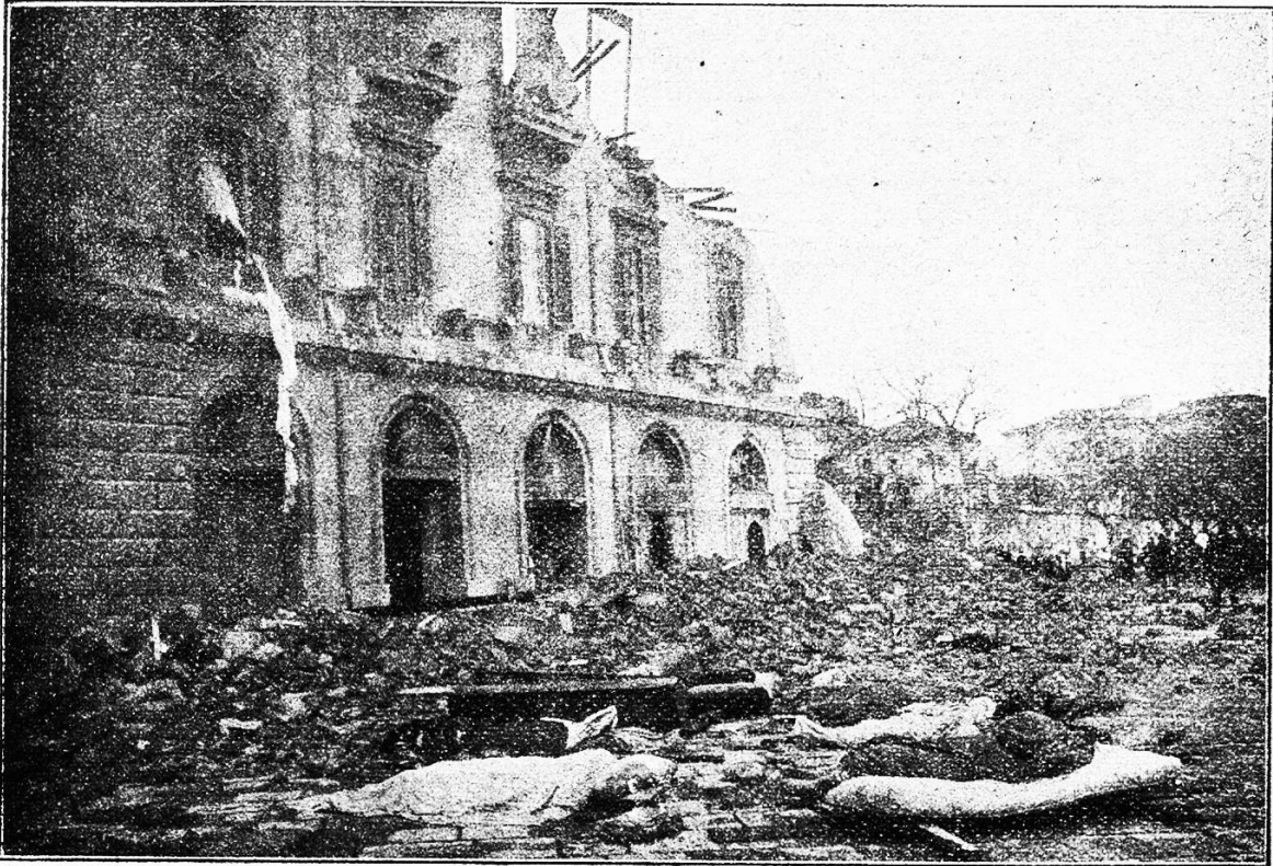
Messina: Hafen-Partie II.

Landesteile Italiens gebracht, daß es sich rechtfertigt, auch in einer Zeitschrift, die sonst keine Tagesereignisse registriert, die Erinnerung daran im Bilde festzuhalten. Wenn es angesichts der furchtbaren Verwüstung und der entsetzlichen Vernichtung von 200,000 Menschenleben, die ein ehernes Naturgesetz hervorrief, für die Menschheit einen Trost gibt, so ist es der, zu sehen,