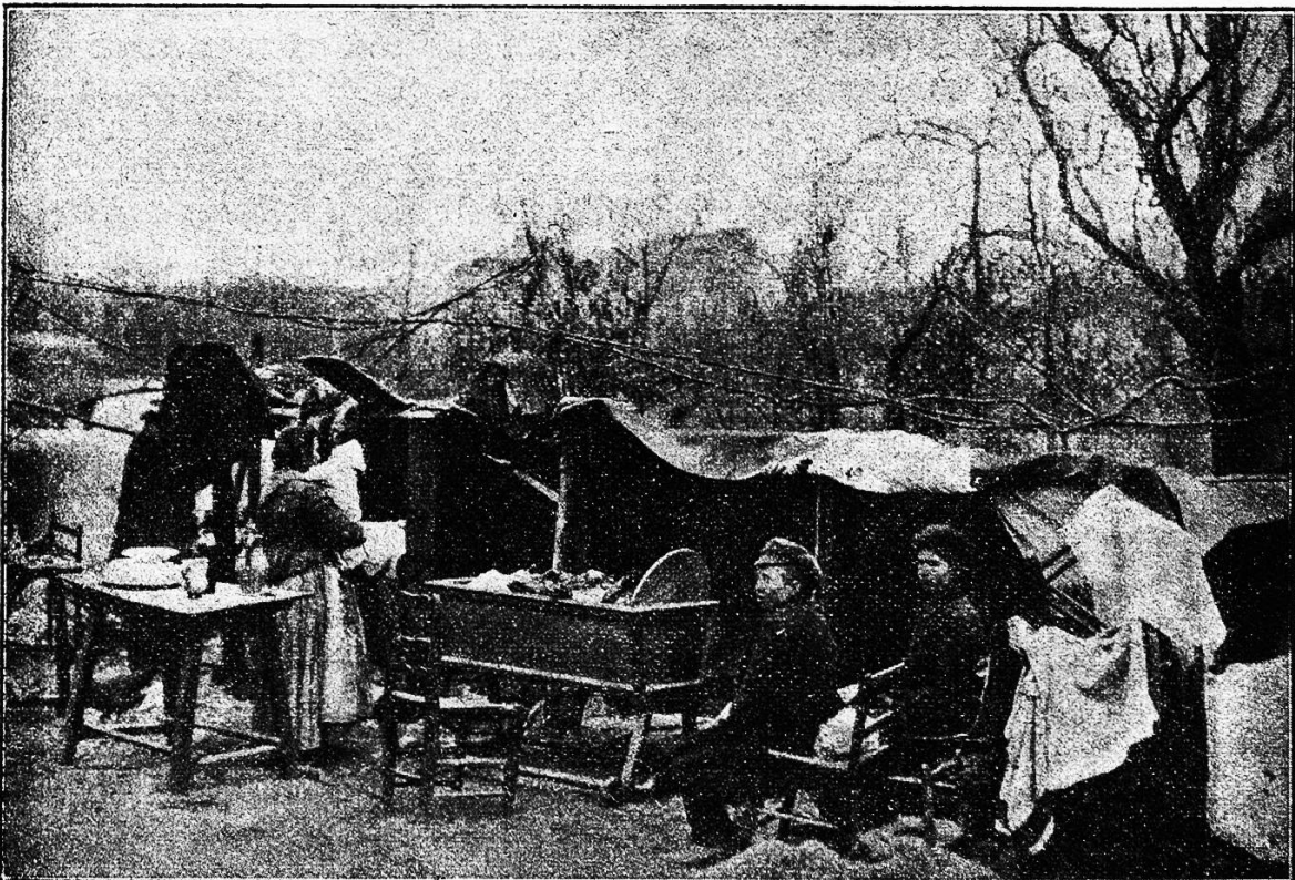
Improvisierte Zeltwohnungen in Messina

Landesteile Italiens gebracht, daß es sich rechtfertigt, auch in einer Zeitschrift, die sonst keine Tagesereignisse registriert, die Erinnerung daran im Bilde festzuhalten. Wenn es angesichts der furchtbaren Verwüstung und der entsetzlichen Vernichtung von 200,000 Menschenleben, die ein ehernes Naturgesetz hervorrief, für die Menschheit einen Trost gibt, so ist es der, zu sehen,