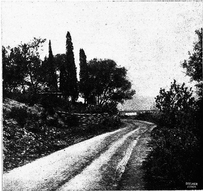
1. Grabkapelle bei Bastia.

von blassen Oliven und ernstesten Zypressen überschatteten Grabkapellen der korsischen Adligen auf das geschäftige Alltagsleben der Stadt herab. Zu unsern Füßen brechen sich die Wellen des Meeres an der felsigen Küste, und fern im Osten zeigen sich die verschwommenen Umrisse der Felseninsel Capraia, an der wir im ersten dämmernden Morgen grauen vorbeifahren sind.