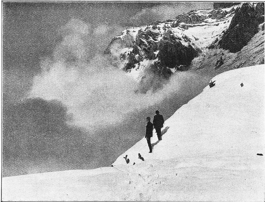
In der Umgebung der Fridolinshütte. Blick auf das Nebeltreiben, hinten der Selbsanft bei Linthal.