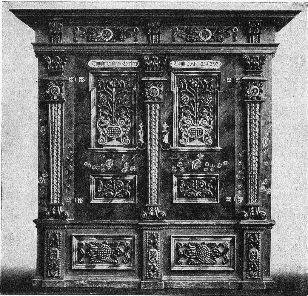
Loggenburger Schrank aus dem Rietbad bei Neßlau, 1797.

Eine geistig rege, an Berufsinteressen des Gatten und der Kinder mit lebhaftem Geist teilnehmende Frau und Mutter gereicht den ihrigen zum doppelten Segen, indem sie nicht bloß für