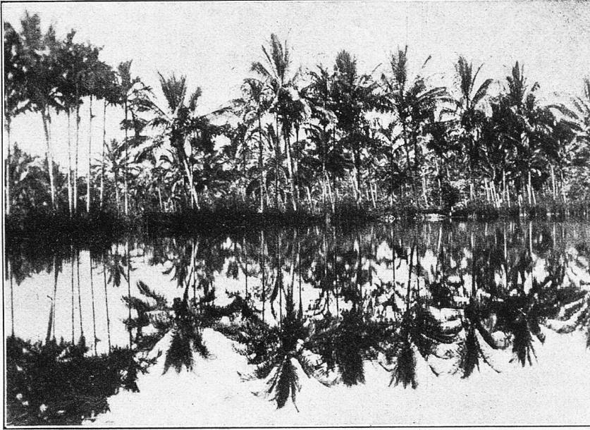
Weiher bei Tjipanas. (Garut).

von prächtigen Bergformen, reich an lohnenden Ausflügen, war wohl dazu angetan, zu längerem Bleiben zu verlocken. Unangenehm waren nur die regelmäßig eintretenden Nachmittagsregen, die dieser Jahreszeit (Mai) eigen waren, so daß nur die Vormittage zum Besuch der Umgebung benutzt werden konnten. Ein solcher Ausflug führte uns nach Tjipanas, warmen Quellen am Fuße des Guntur, die zum Wohle der leidenden Menschheit in Bäder gefaßt sind. Wenig unterhalb dieser Kurgelegenheit liegt ein malerisches Teichgebiet, dessen wunderbare Spiegel ihre Umrahmung mit Kokospalmen prachtvoll wiedergeben, wie denn überhaupt die ganze Ebene reich an kleinen Seen ist, abgesehen davon, daß sie selbst, wenn die vielen Sawahs mit Wasser überschwemmt sind, im Abend- oder Morgenrot den Eindruck eines großen Binnensees zu machen im Stande ist.