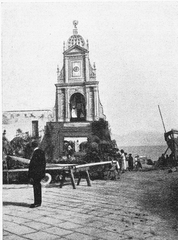
Altar in Torre del Greco.

Ich durchschreite das bunte Gewühl und wandere durch die kleinen Gassen gegen das Meer hinunter, wo auch einer dieser Altäre steht. Zu seiner Rechten erhebt sich der Bug eines auf den Sand gezogenen Lastschiffes. Zwischen ihm und dem Altar leuchtet die blaue Flut. Hier ist es still, wenn Menschen da waren, so haben sie sich alle gegen den Hauptplatz verloren. Fast einsam steht das Bauwerk da mit seinem vorgelagerten Blumengarten. Die Straße steigt in einer Treppe zu ihm und dem Meer hinunter. Auf ihr kniet eben ein junger Mönch in der braunen Kutte der Kapuziner in tiefes Sinnen versunken, den geschälten Wanderstab auf die Stufen gelegt. Plötzlich schnellt er auf wie eine Gerte, wirft die Arme in die Luft und steht kerzengerade da, die Augen schwärmerisch zum Altare erhoben. Und über den Platz schallt seine Stimme, voll und wohl-tönend wie das Brausen einer Orgel. Seine Rede strömt in breiter Fülle, da ist kein Stokfen, kein Suchen. Sie ist eine glühende Lobpreisung der Madonna. Hat er vergessen, daß