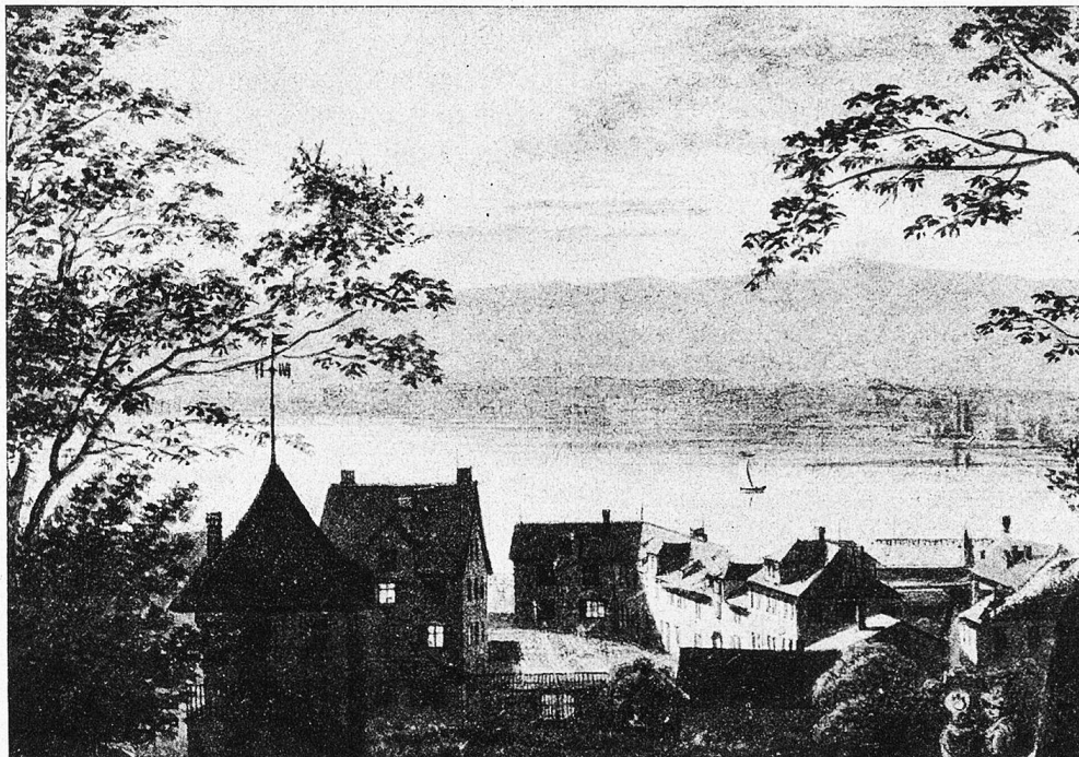
Alter Hof von Stadelhofen.