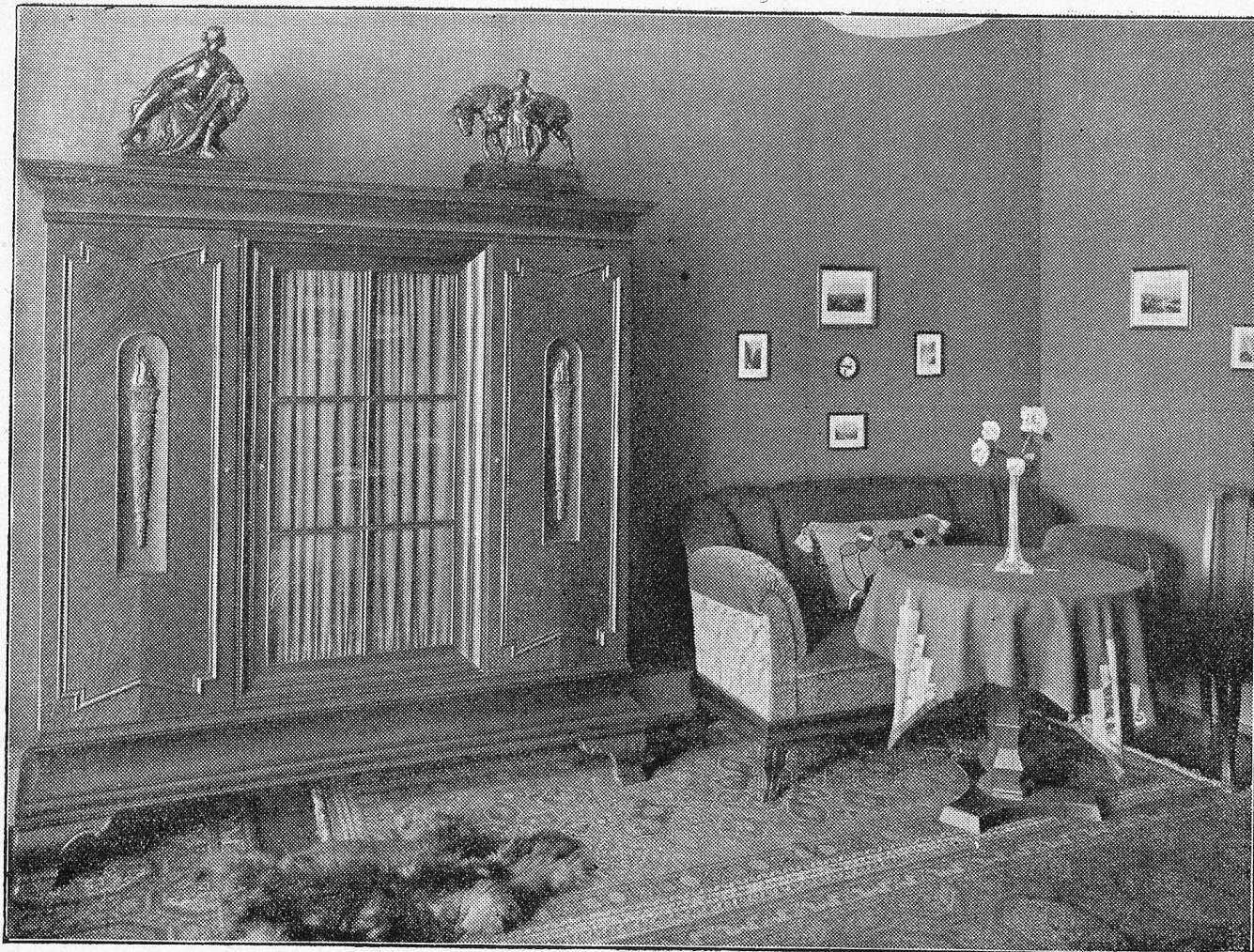
Teilansicht aus einem neuzeitlichen Herrenzimmer in geräuchertem Eichenholz.