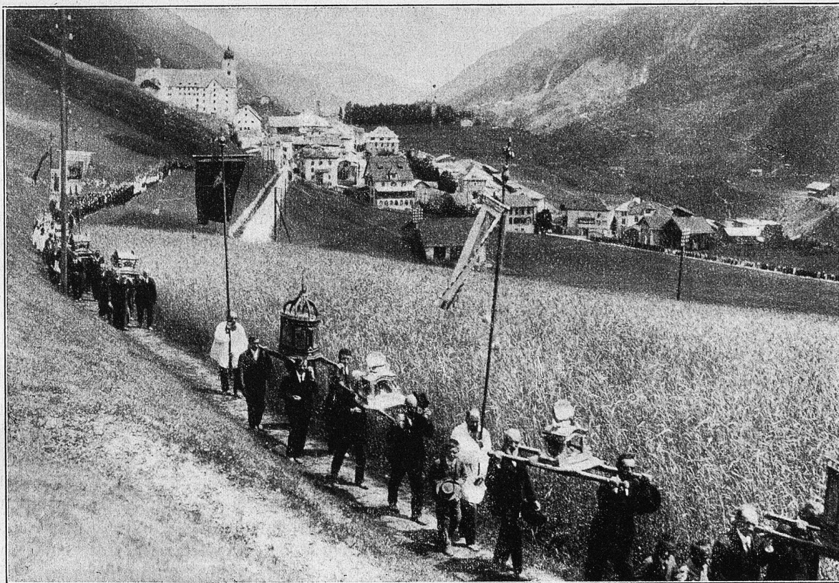
Plazidus-Prozession in Disentis.

Schnurgerade, wie die neuen Seile, an de-