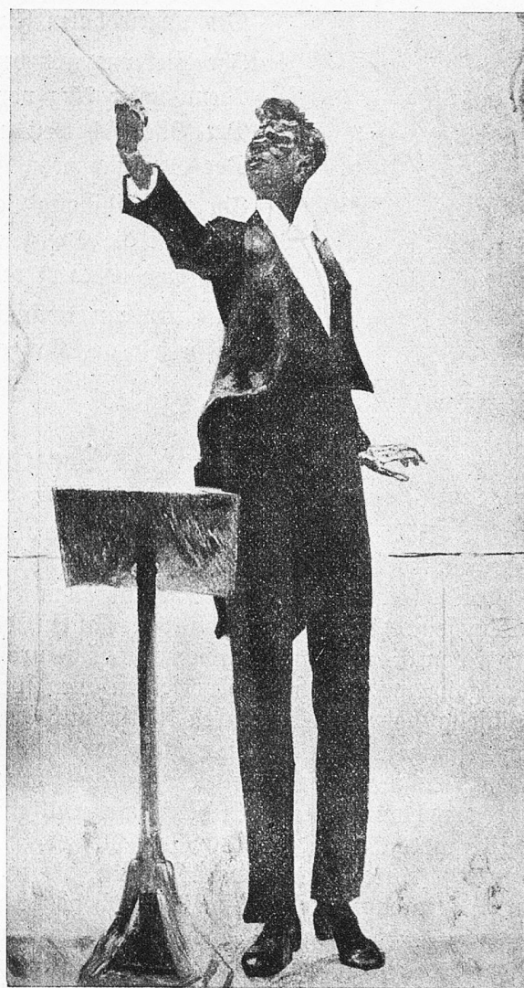
Der Dirigent. Von Cuno Amiet.

fern, seinen herrlichen Bäumen, aus denen er die Seele der Natur herausholt, hat niemand mit solcher Liebe gemalt wie er. Welch zitterndes Licht in seinen Innenräumen, welche Bewegung in seinen flatternden Vorhängen. Daß er ein Malerpoet ist, offenbaren seine in gedämpften Farben gehaltenen allegorischen Bilder, die wir unsern Lesern später einmal vor-