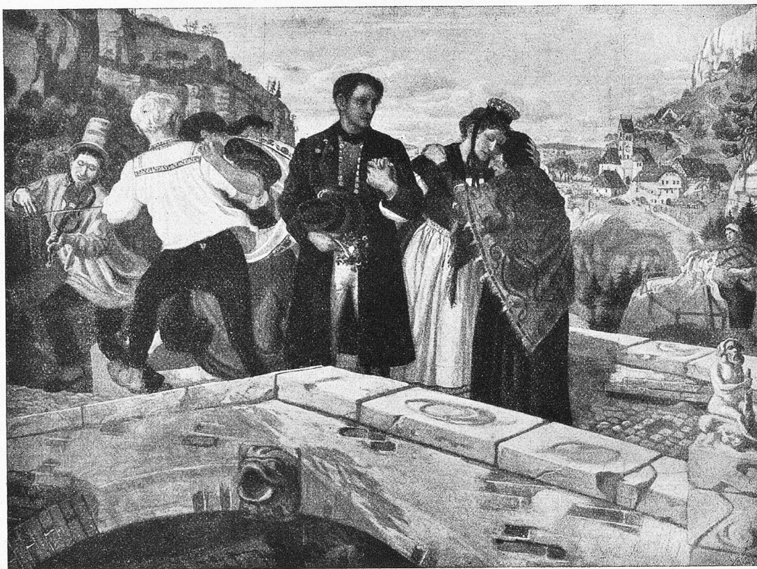
Hochzeitszug auf der Brücke. Von Albert Welti.

Grund tüchtigen Wissens die Entwicklung der Malerei im Mittelalter, von der sich erst im 17. Jahrhundert die französische abzusondern begann, und zeigt, wie die Schweizer Malerei sich restlos in die oberdeutsche einschloß. Erst Arnold Böcklin offenbart Schweizernatur in seiner Kunst, weshalb ihm auch die Deutschen