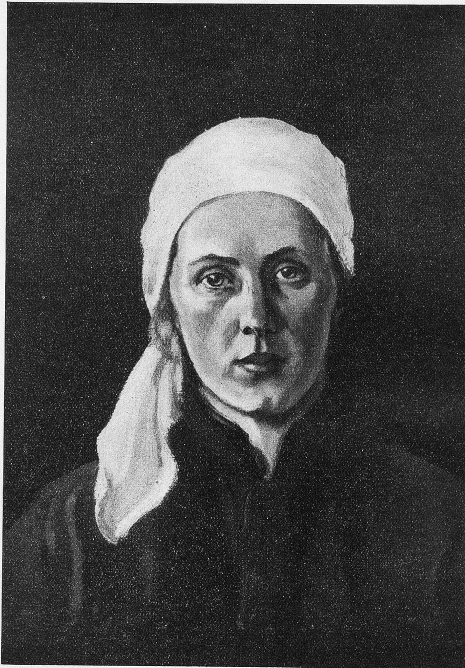
Lydia (die Gattin des Künstlers). Gemälde von Albert Nyfeler.

glaubt. Zu oft hat er's erfahren, als daß er daran zweifeln könnte.